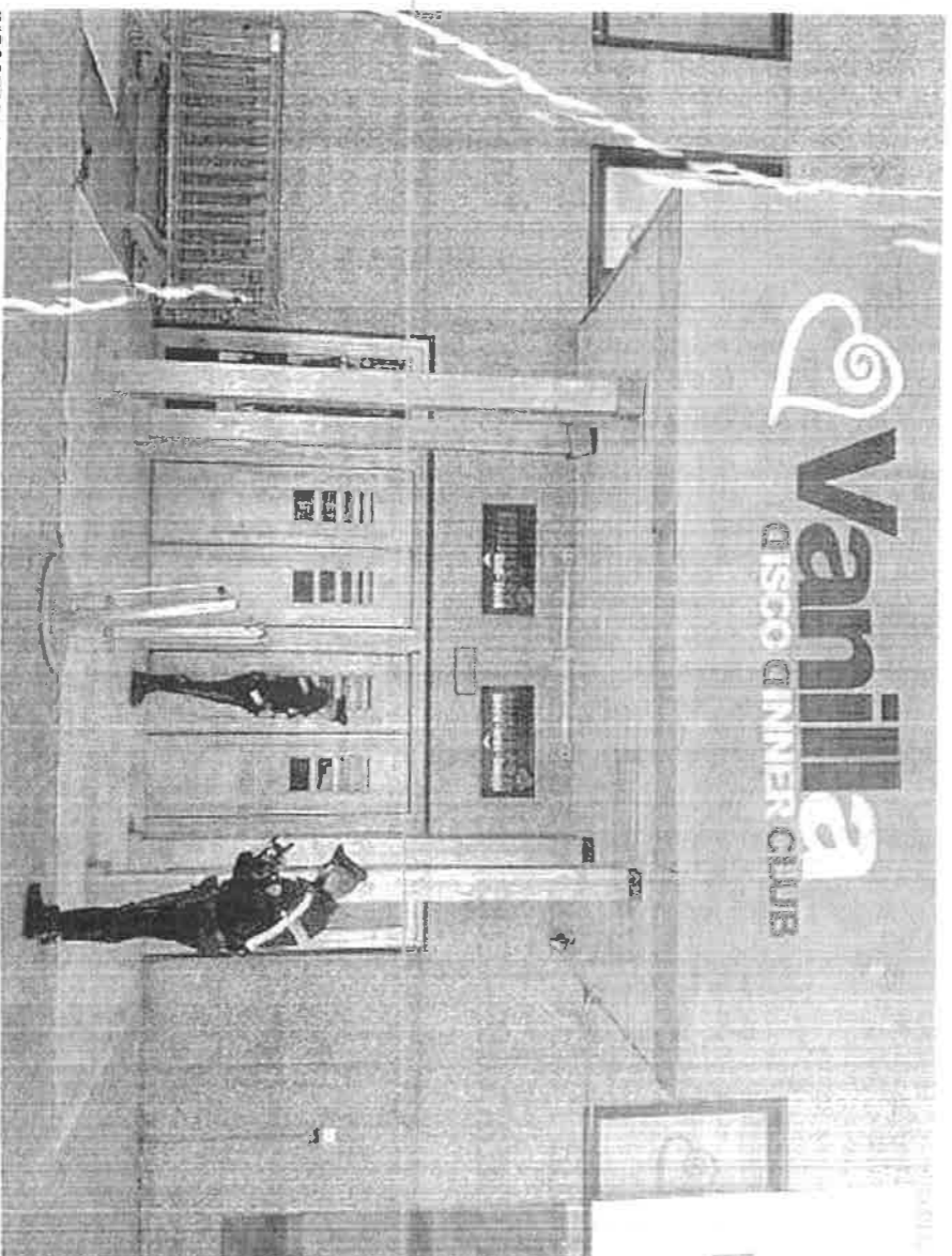
DISCOTECA I carabinieri davanti al «Vanilla». Sopra, subito dopo la sparatoria avvenuta venerdì notte

I due lavorano nello stesso campo, offrono cioè servizi di pulizia