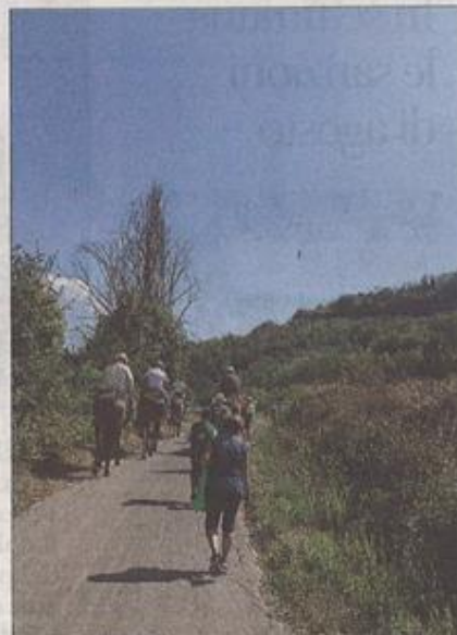
Via Francigena Adesso fa parte anche del portale dei cammini

L'idea di realizzare un portale unico dedicato ai cammini è nata durante l'anno Nazionale dei Cammini 2016 proclamato con una direttiva del Mibact e che ha visto insieme impegnati Stato, Regioni, Comuni, Enti locali, pubblico e privato per valorizzare 6600 chilometri di cammini naturalistici, religiosi, culturali e spirituali che attraversano l'intero Paese, una fetta d'Italia poco conosciuta, ma fondamentale nell'offerta del turismo lento italiano.