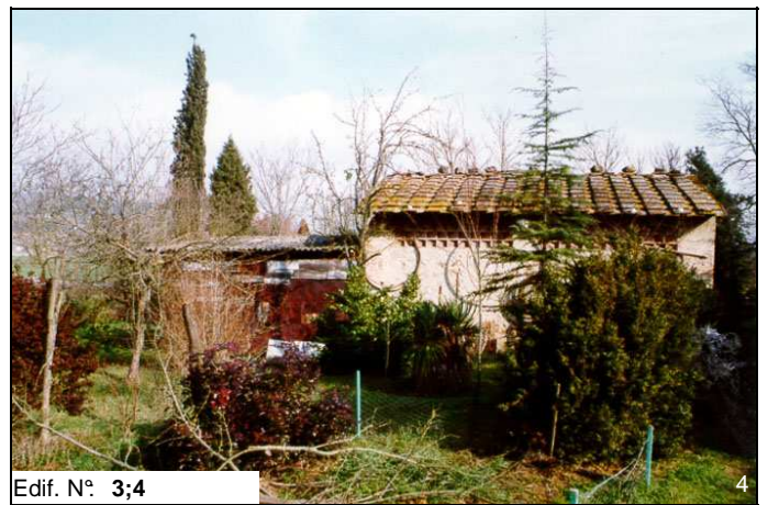
Edif. N° 3;4