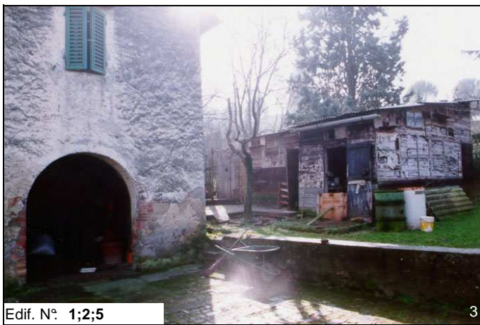
Edif. N° 1;2;5