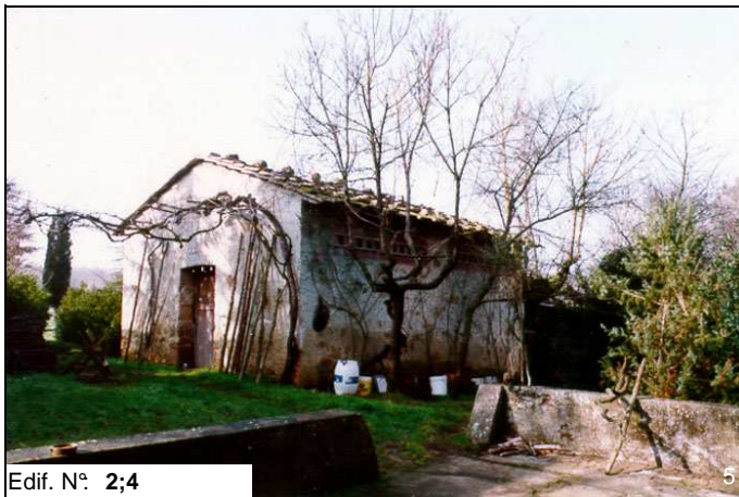
Edif. N° 2;4