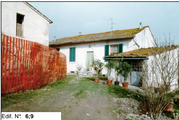
Edif. N° 6;9