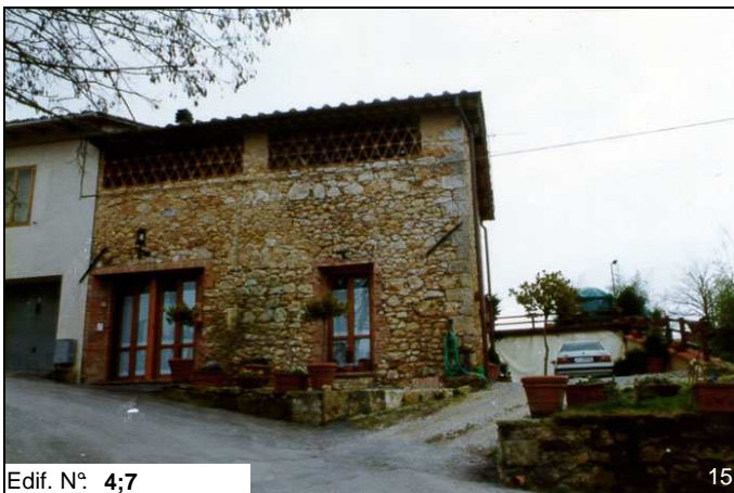
Edif. N° 4;7