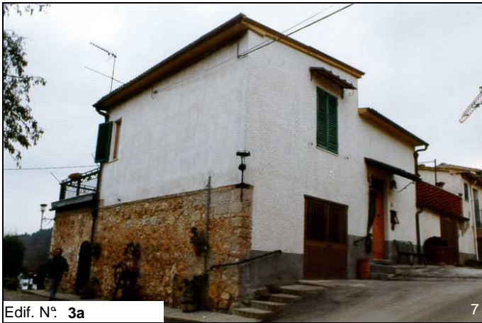
Edif. N° 3a