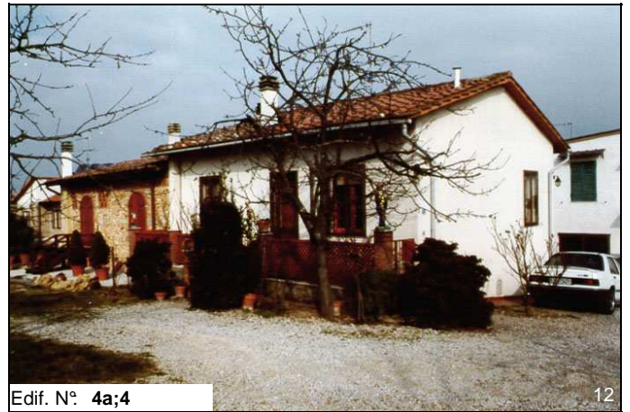
Edif. N° 4a;4