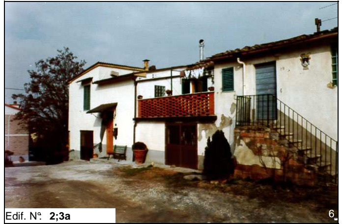
Edif. N° 2;3a