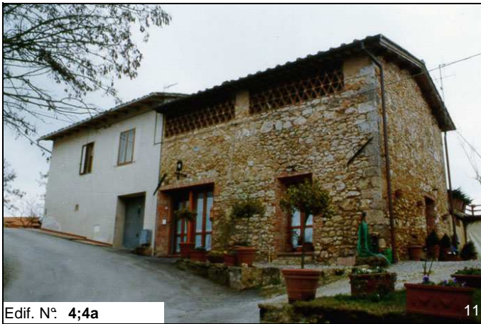
Edif. N° 4;4a