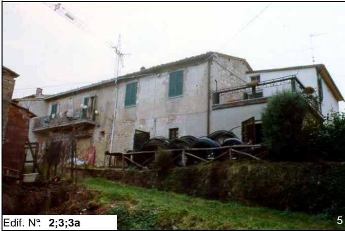
Edif. N° 2;3;3a