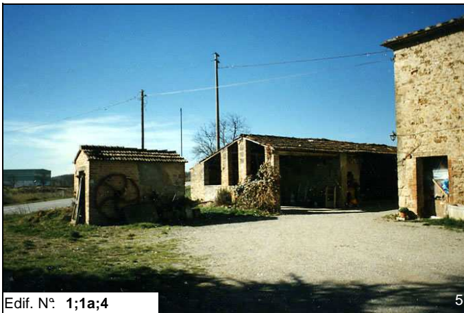
Edif. N° 1;1a;4