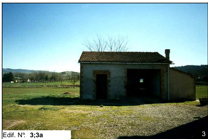
Edif. N° 3;3a