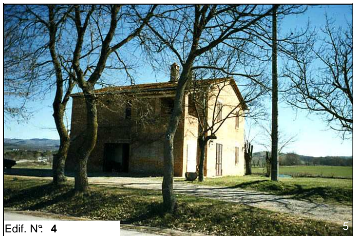
Edif. N° 4