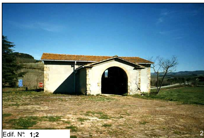
Edif. N° 1;2