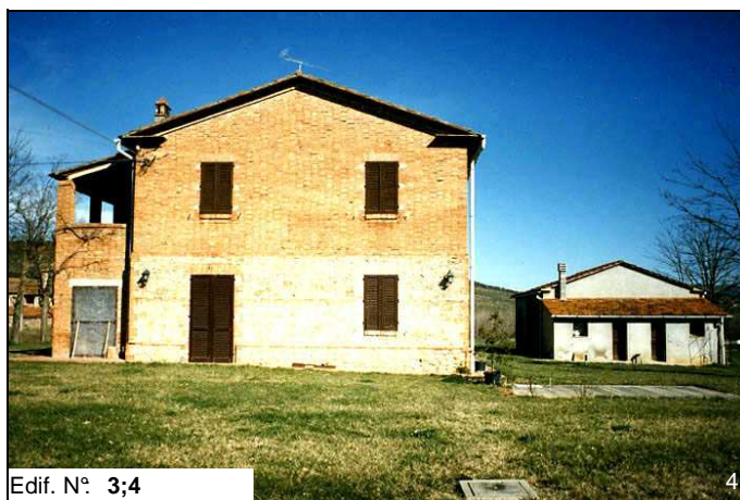
Edif. N° 3;4