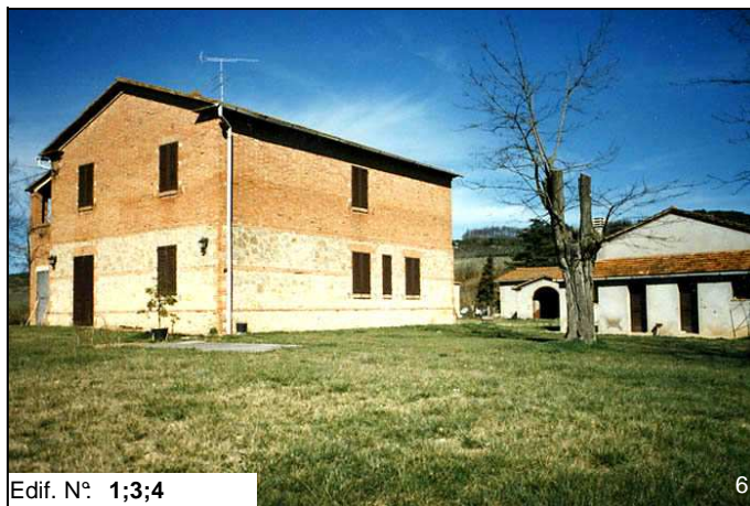
Edif. N° 1;3;4