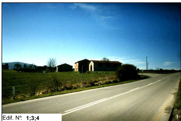
Edif. N° 1;3;4