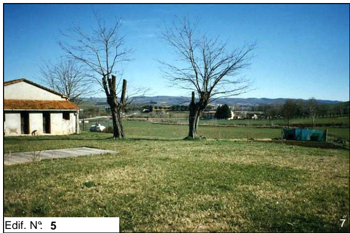
Edif. N° 5