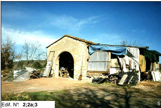
Edif. N° 2;2a;3