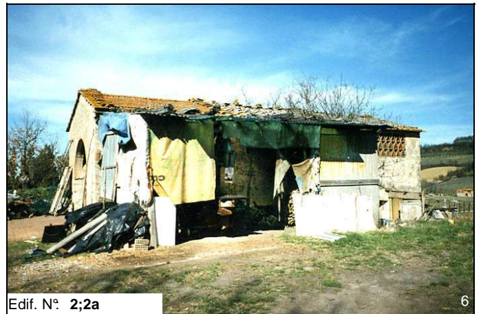
Edif. N° 2;2a