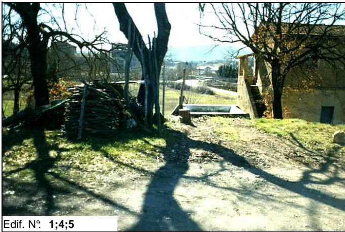
Edif. N° 1;4;5