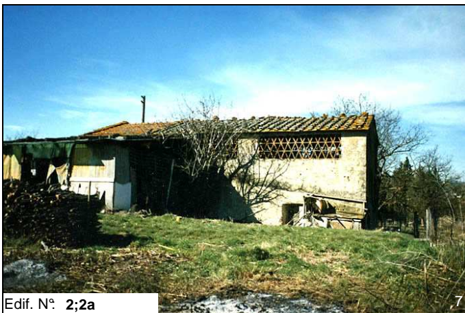
Edif. N° 2;2a