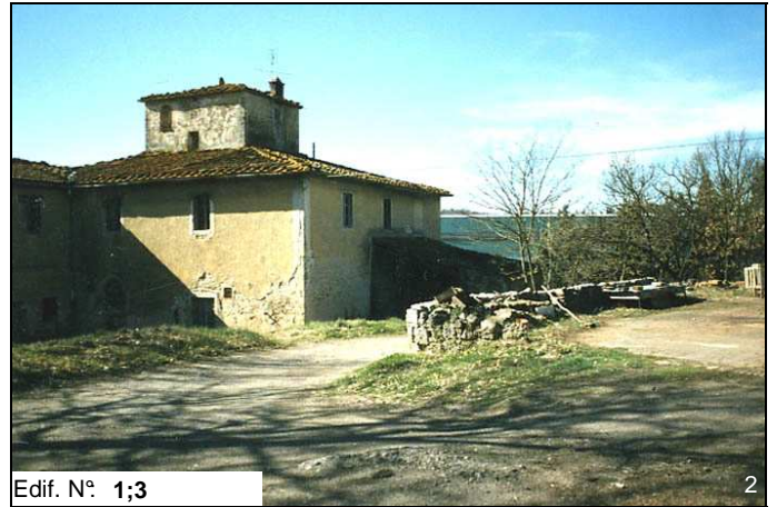
Edif. N° 1;3