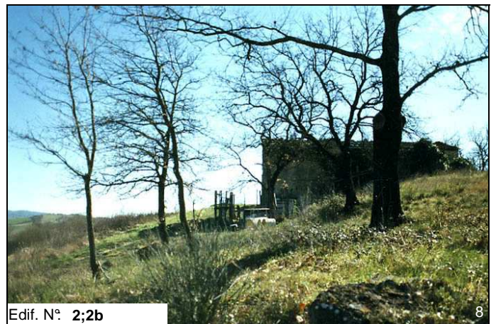
Edif. N° 2;2b