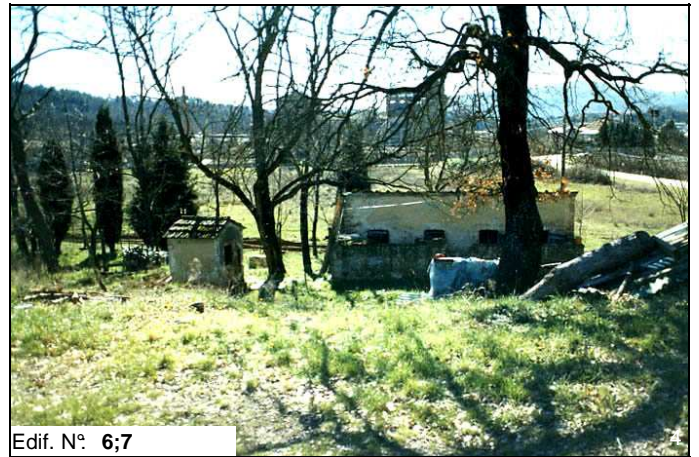
Edif. N° 6;7