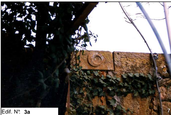
Edif. N° 3a