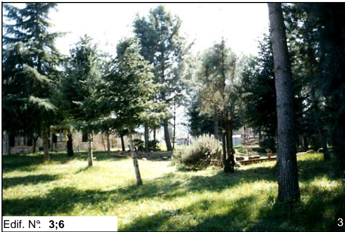
Edif. N° 3;6