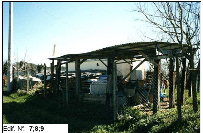
Edif. N° 7;8;9