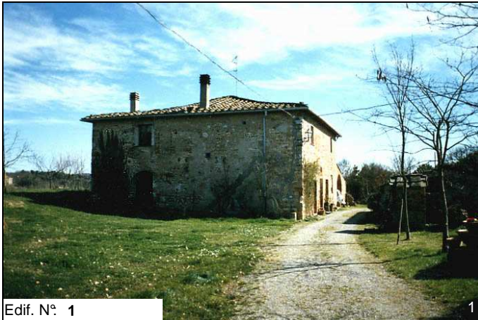
Edif. N° 1