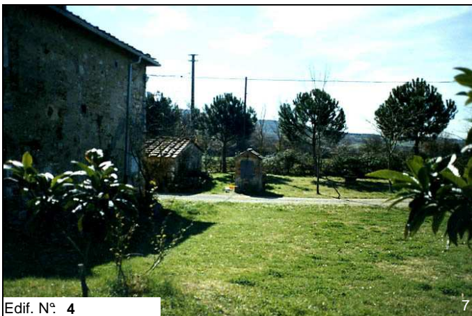
Edif. N° 4