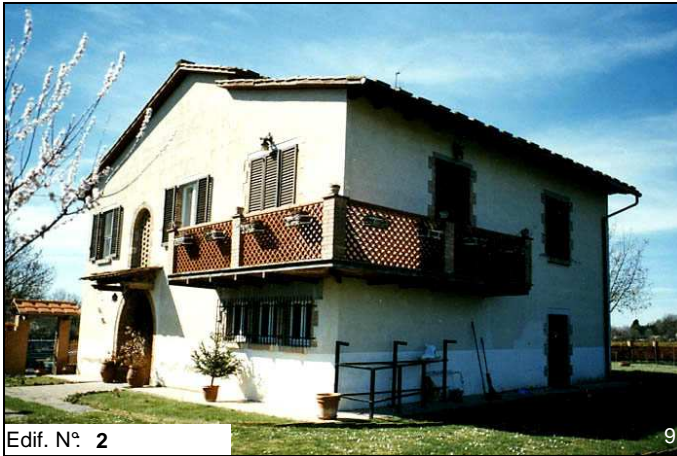
Edif. N° 2