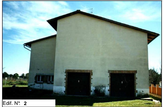
Edif. N° 2