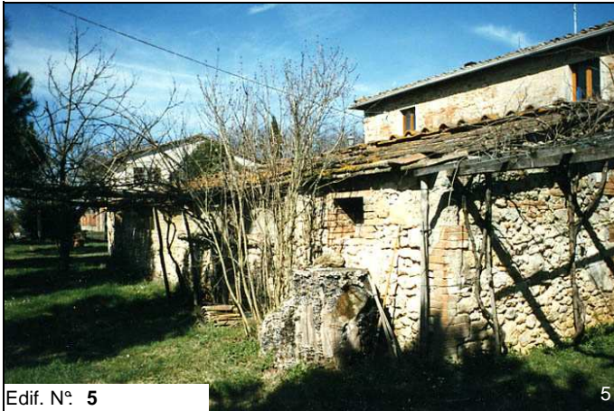
Edif. N° 5