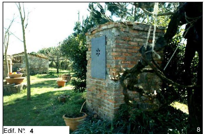
Edif. N° 4