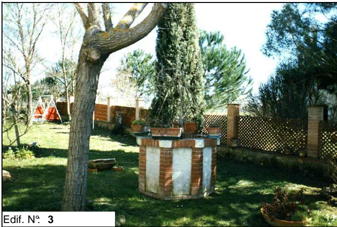
Edif. N° 3