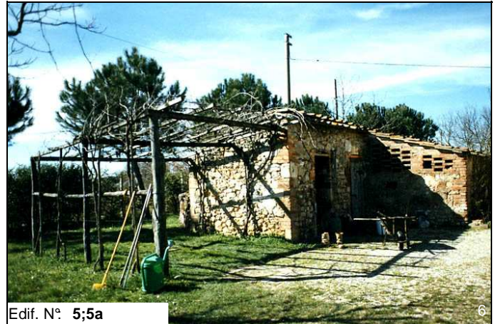
Edif. N° 5;5a