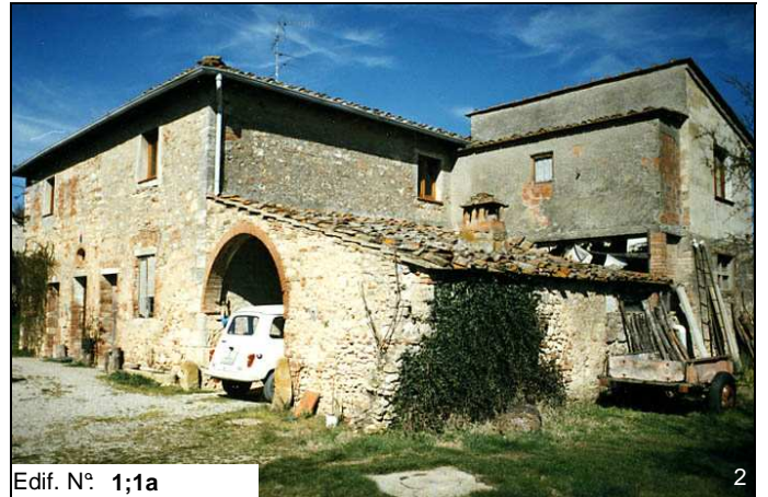
Edif. N° 1;1a