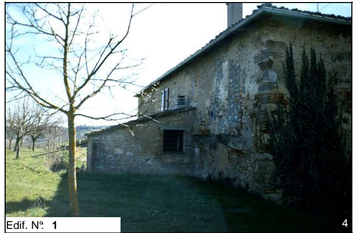
Edif. N° 1