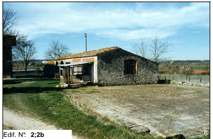
Edif. N° 2;2b