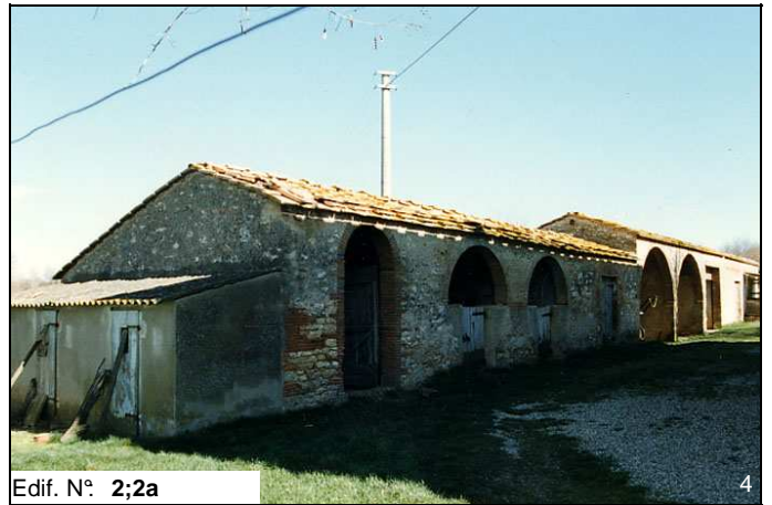
Edif. N° 2;2a