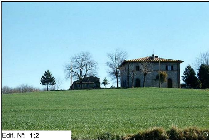
Edif. N° 1;2