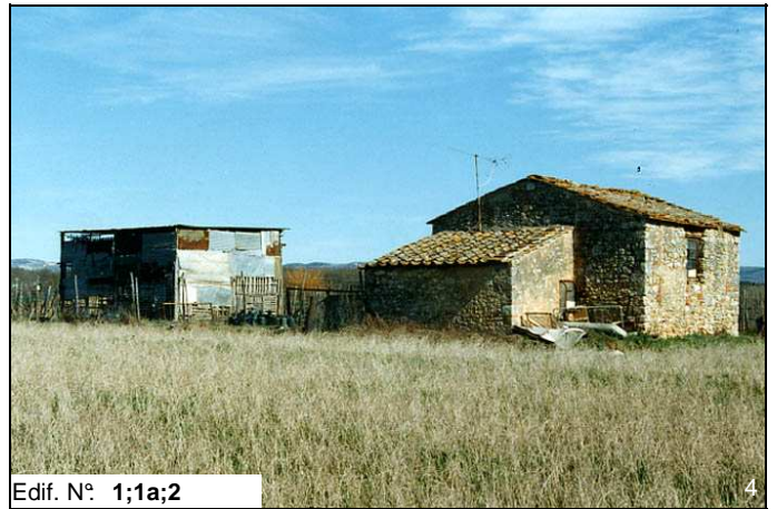
Edif. N° 1;1a;2