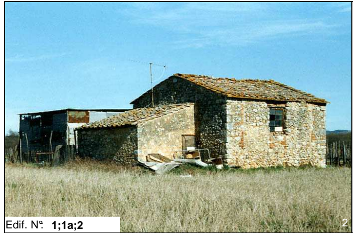
Edif. N° 1;1a;2