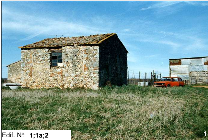
Edif. N° 1;1a;2