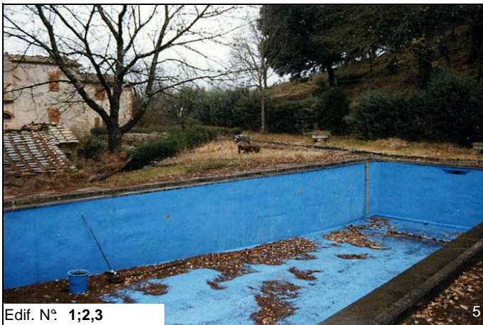
Edif. N° 1;2,3