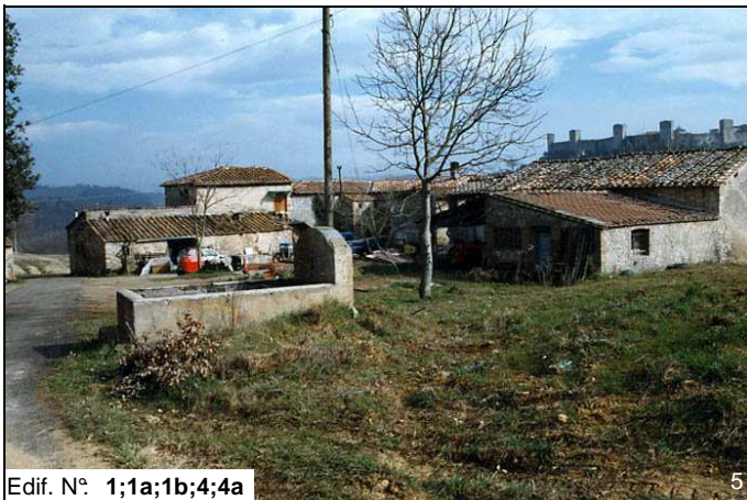
Edif. N° 1;1a;1b;4;4a