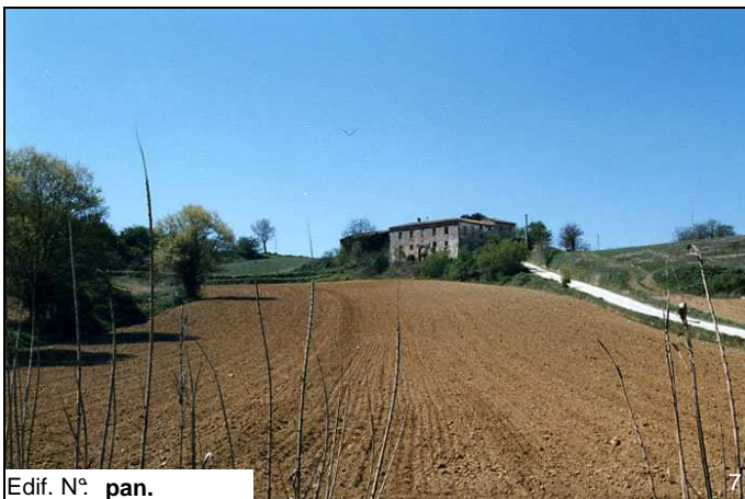
Edif. N° pan.