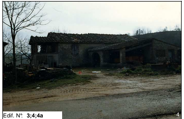
Edif. N° 3;4;4a