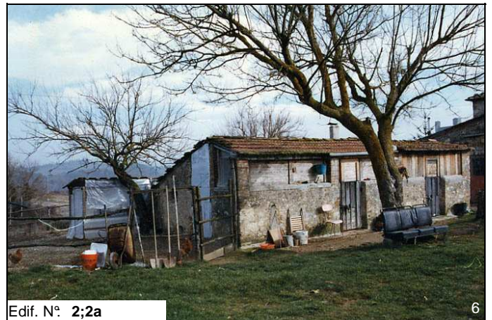
Edif. N° 2;2a