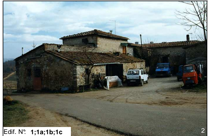
Edif. N° 1;1a;1b;1c