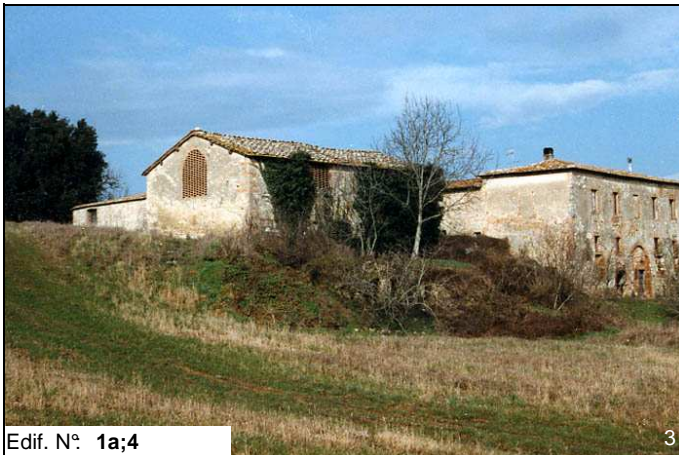
Edif. N° 1a;4