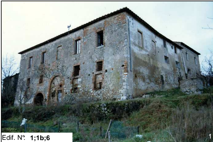
Edif. N° 1;1b;6