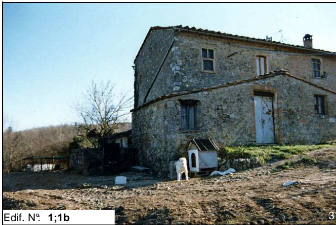
Edif. N° 1;1b