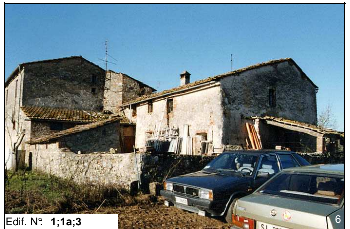
Edif. N° 1;1a;3