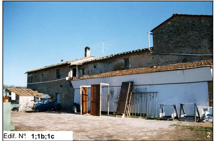
Edif. N° 1;1b;1c