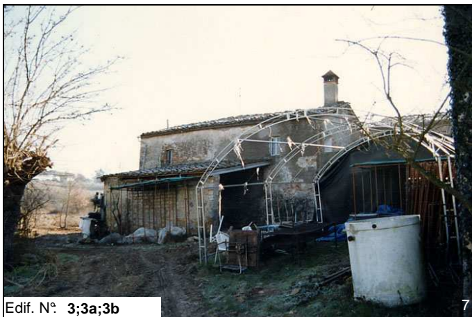
Edif. N° 3;3a;3b