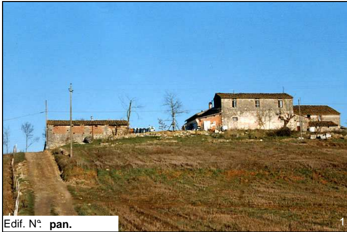
Edif. N° pan.