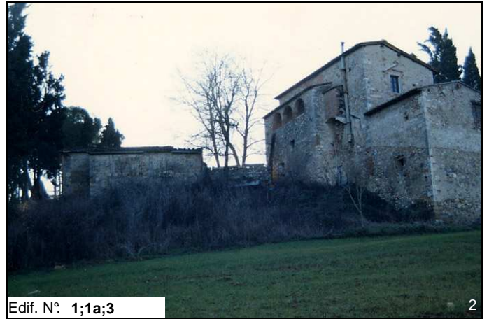
Edif. N° 1;1a;3