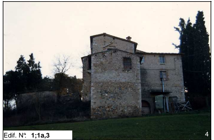
Edif. N° 1;1a;3