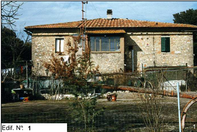
Edif. N° 1