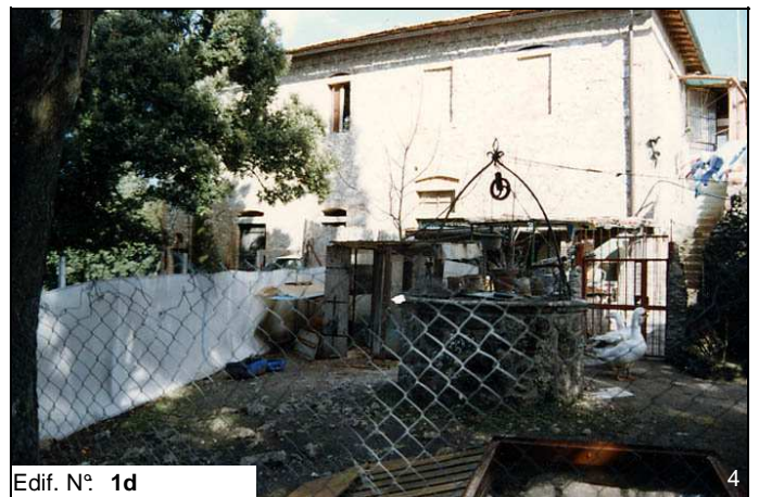
Edif. N° 1d