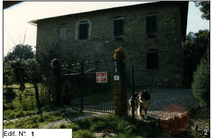
Edif. N° 1