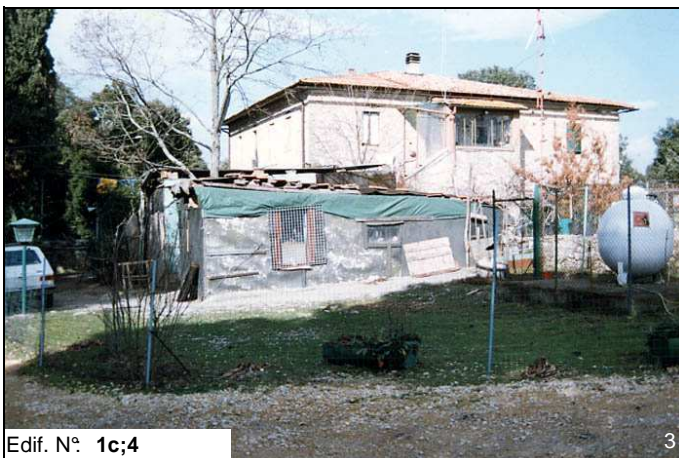
Edif. N° 1c;4