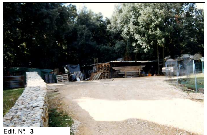
Edif. N° 3