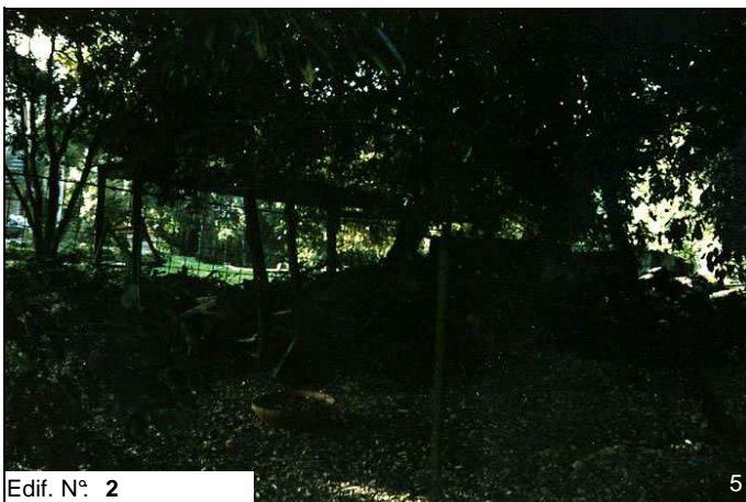
Edif. N° 2