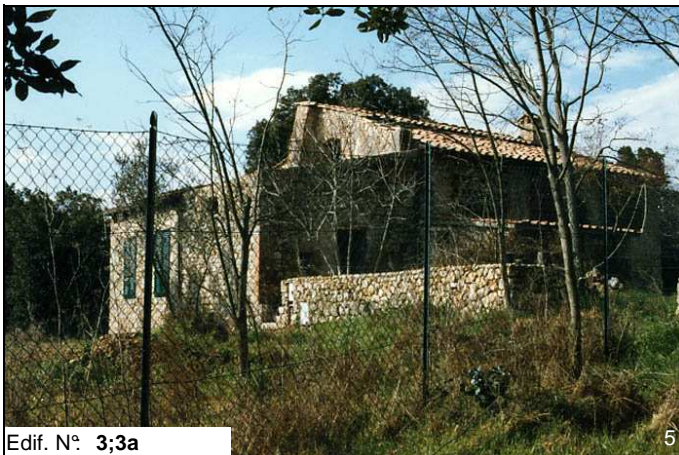
Edif. N° 3;3a