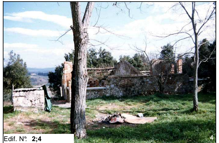
Edif. N° 2;4