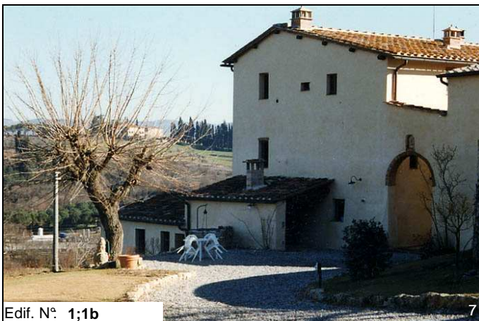
Edif. N° 1;1b