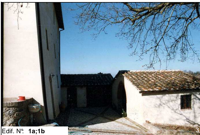
Edif. N° 1a;1b