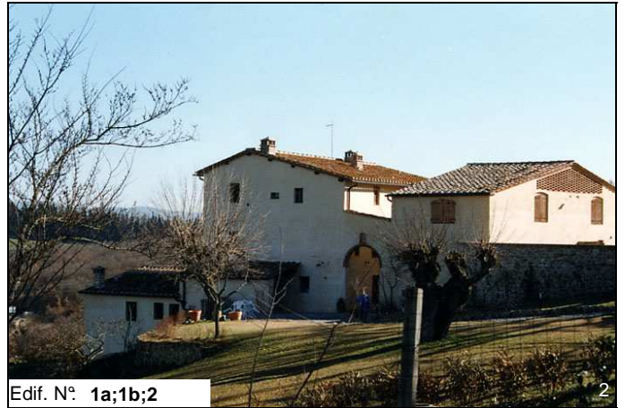
Edif. N° 1a;1b;2