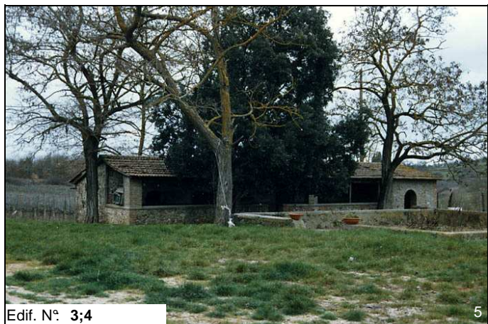
Edif. N° 3;4