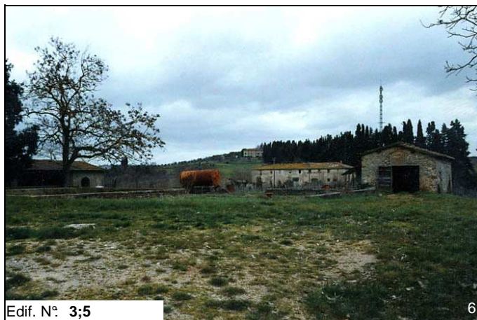
Edif. N° 3;5