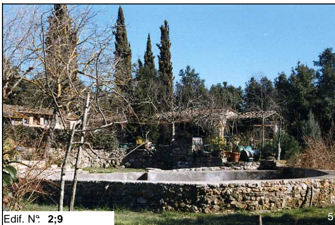
Edif. N° 2;9