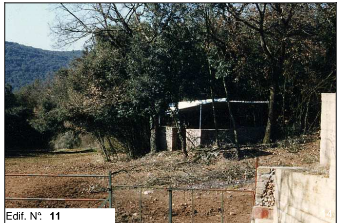
Edif. N° 11