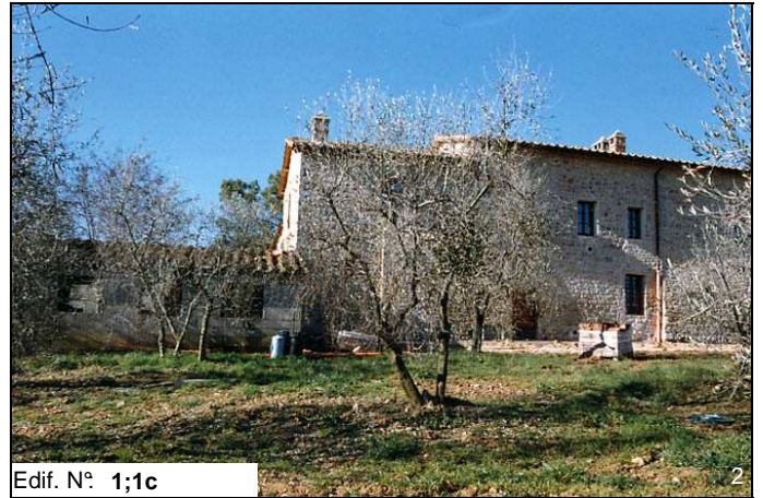
Edif. N° 1;1c