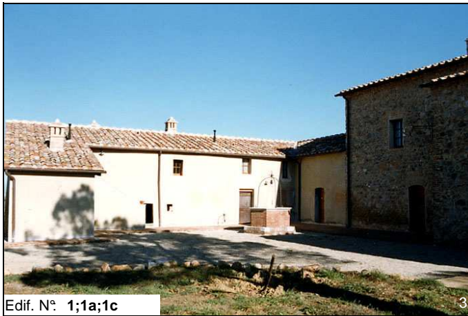
Edif. N° 1;1a;1c