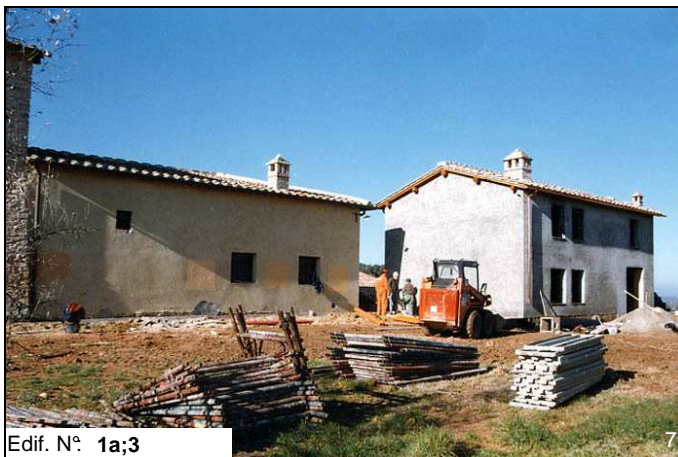
Edif. N° 1a;3