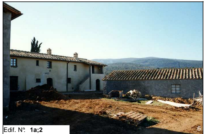
Edif. N° 1a;2