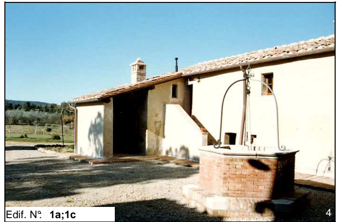
Edif. N° 1a;1c