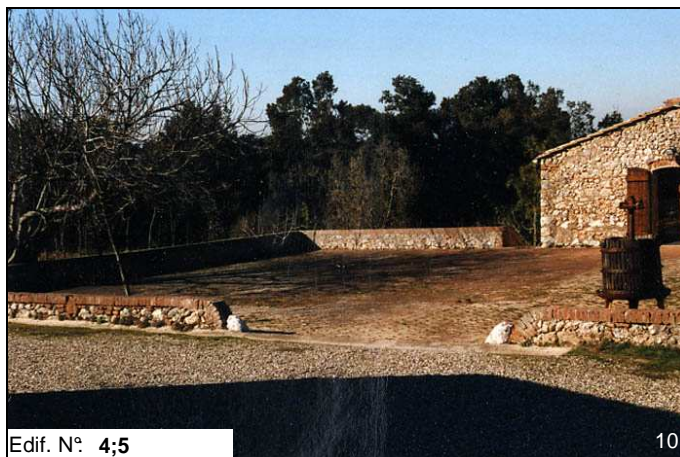
Edif. N° 4;5