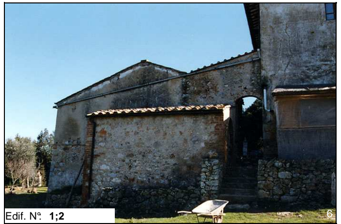
Edif. N° 1;2