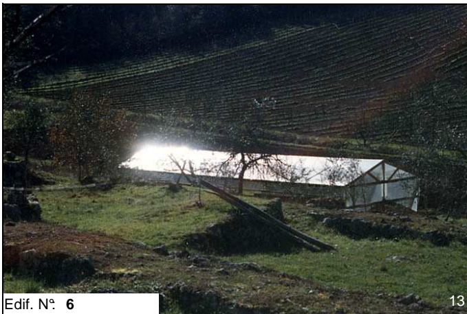
Edif. N° 6