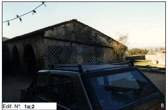
Edif. N° 1a;2