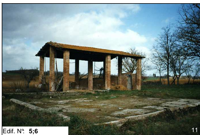
Edif. N° 5;6