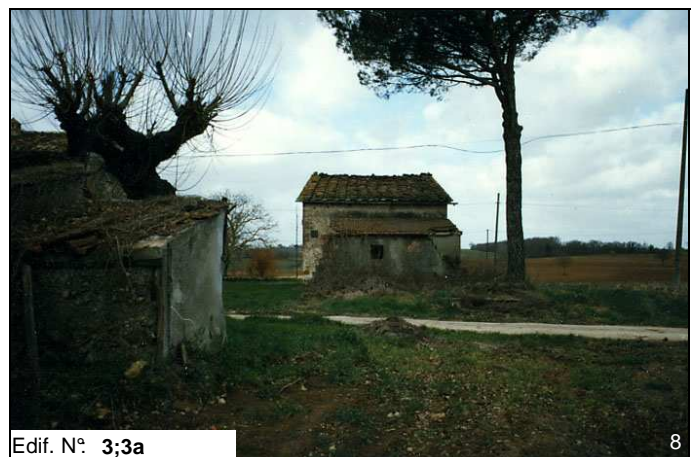
Edif. N° 3;3a