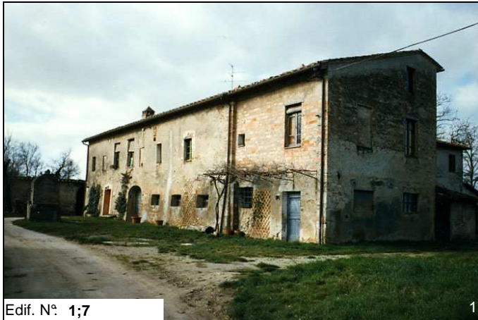
Edif. N° 1;7