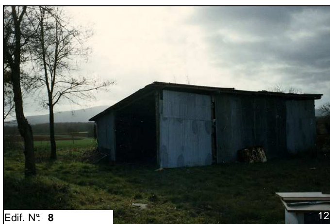
Edif. N° 8