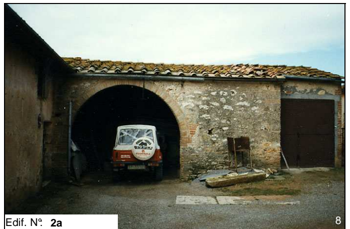
Edif. N° 2a