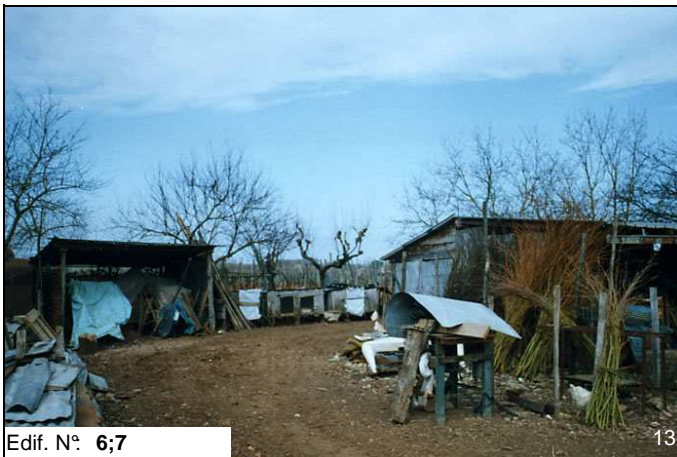
Edif. N° 6;7