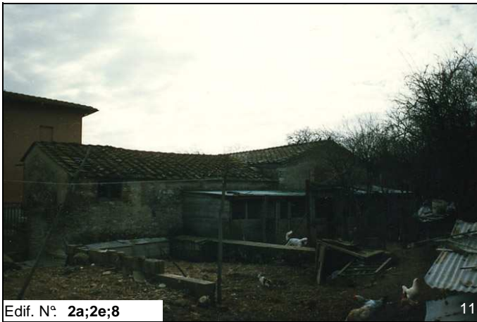
Edif. N° 2a;2e;8