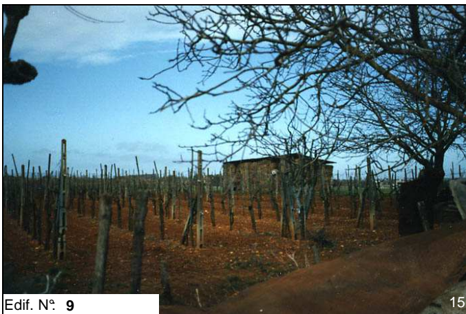
Edif. N° 9