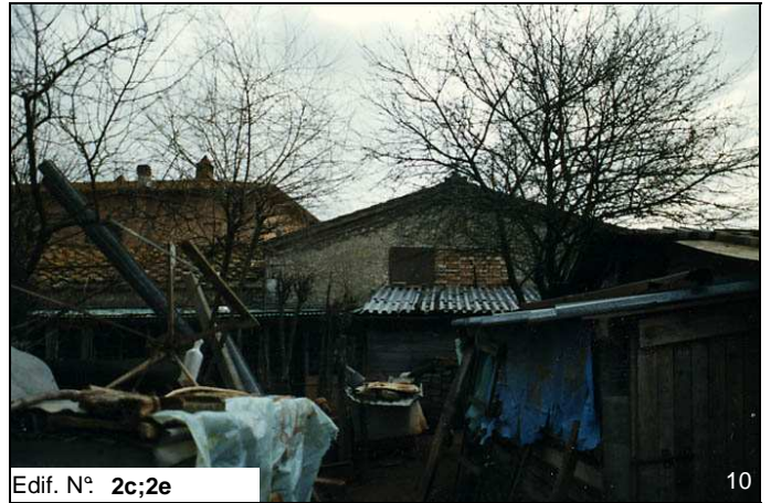
Edif. N° 2c;2e