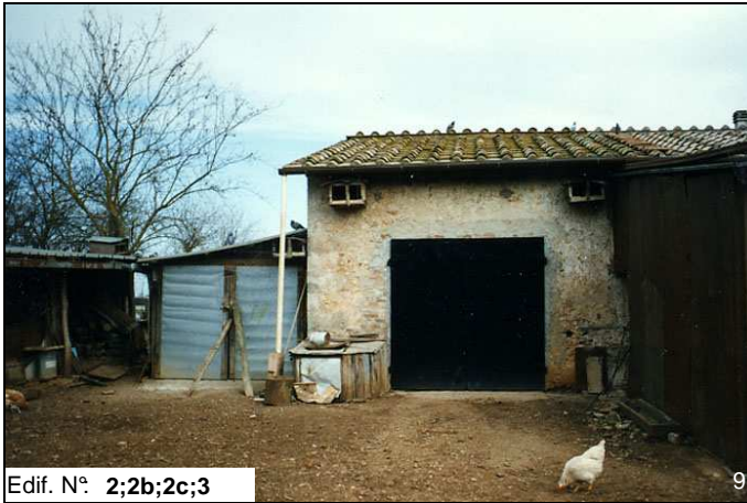
Edif. N° 2;2b;2c;3