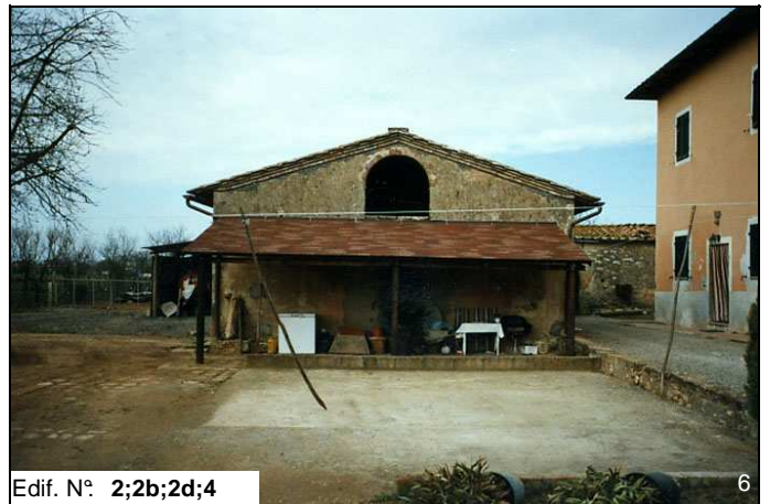
Edif. N° 2;2b;2d;4