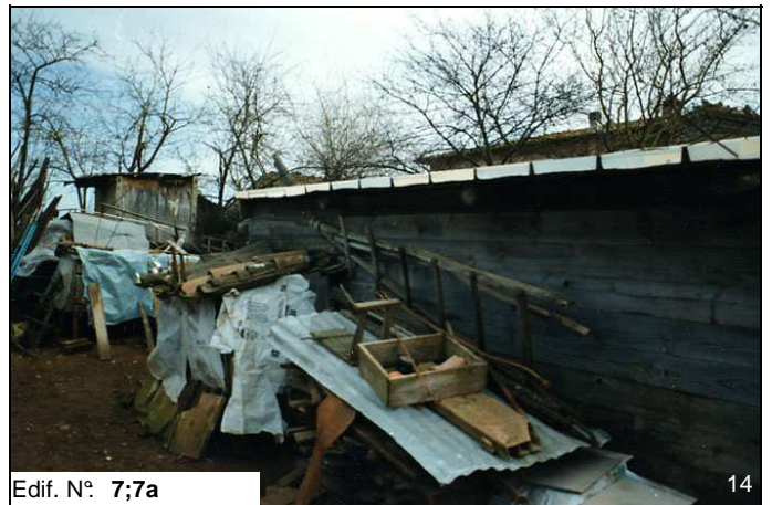
Edif. N° 7;7a