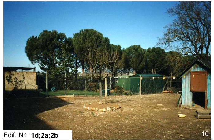
Edif. N° 1d;2a;2b