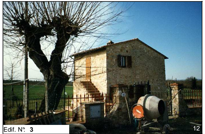
Edif. N° 3