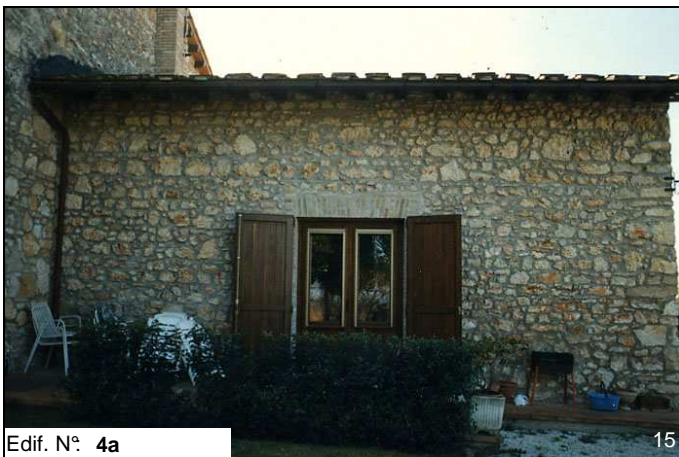
Edif. N° 4a