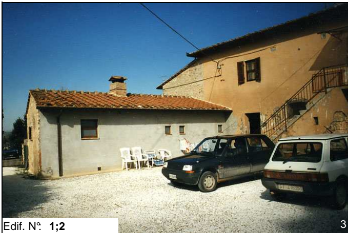
Edif. N° 1;2