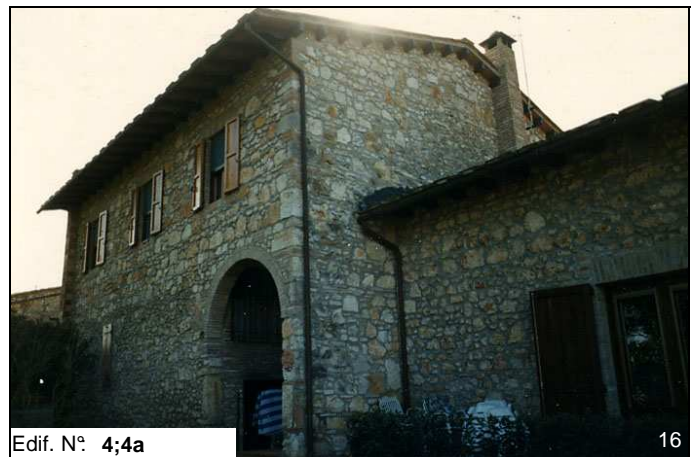
Edif. N° 4;4a