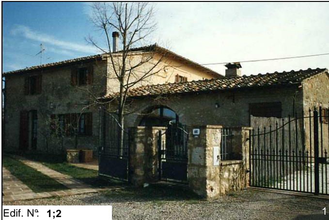
Edif. N° 1;2