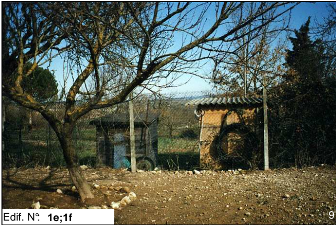
Edif. N° 1e;1f