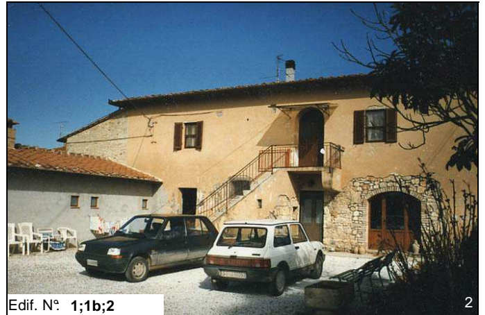
Edif. N° 1;1b;2