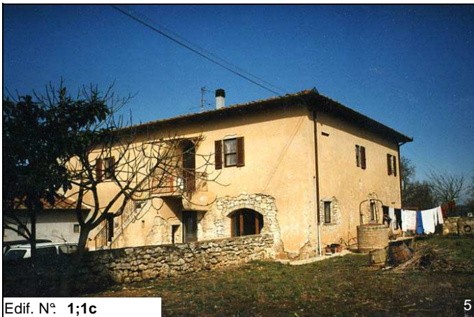
Edif. N° 1;1c