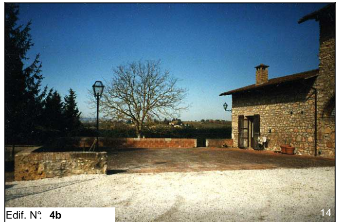
Edif. N° 4b