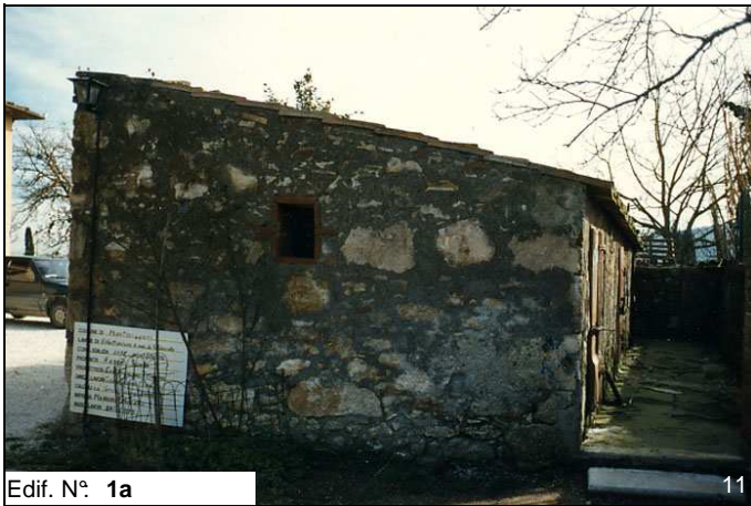
Edif. N° 1a