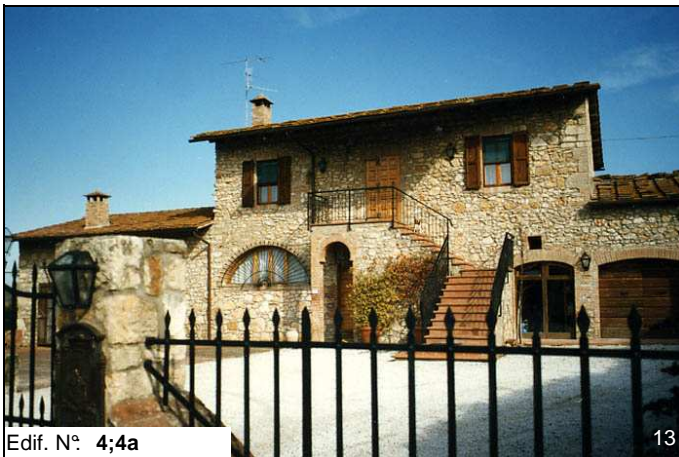
Edif. N° 4;4a