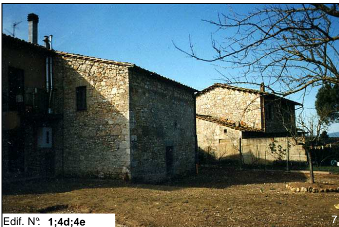
Edif. N° 1;4d;4e