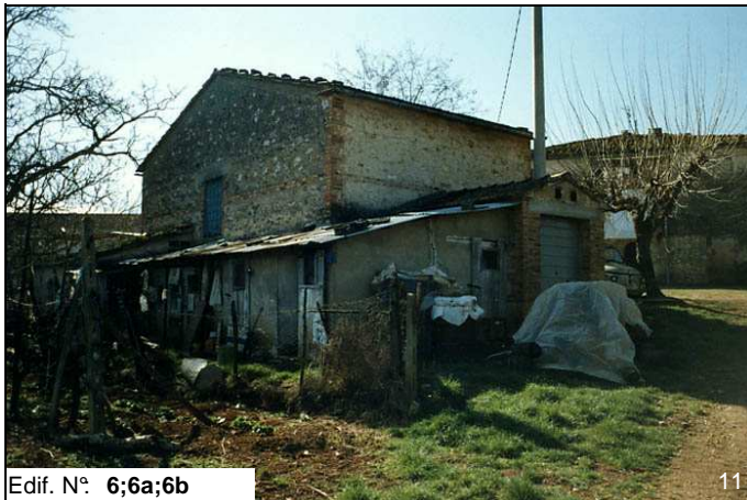
Edif. N° 6;6a;6b