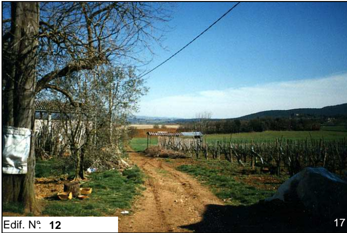
Edif. N° 12