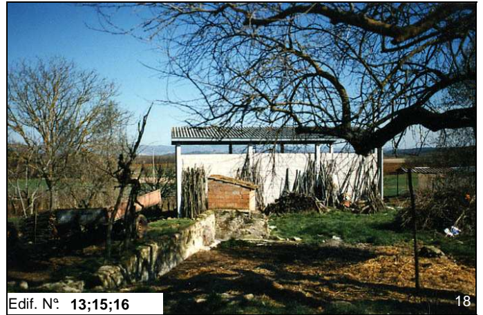
Edif. N° 13;15;16