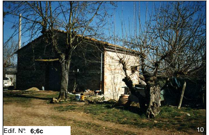
Edif. N° 6;6c