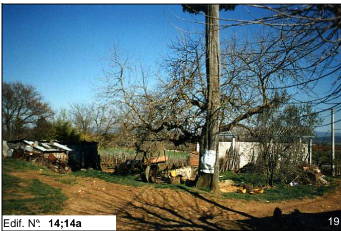
Edif. N° 14;14a