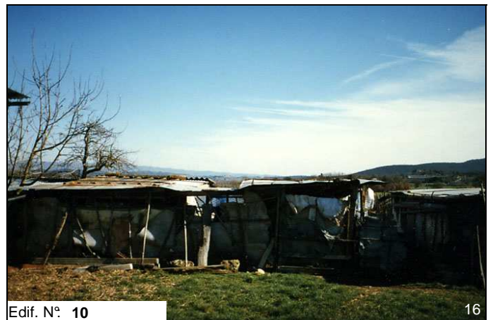
Edif. N° 10