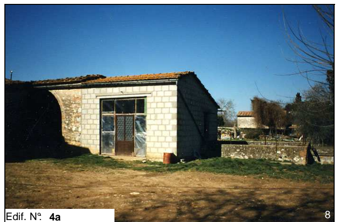
Edif. N° 4a