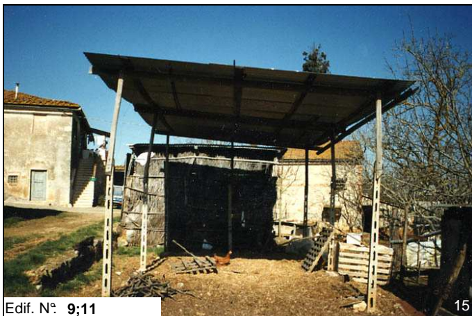
Edif. N° 9;11