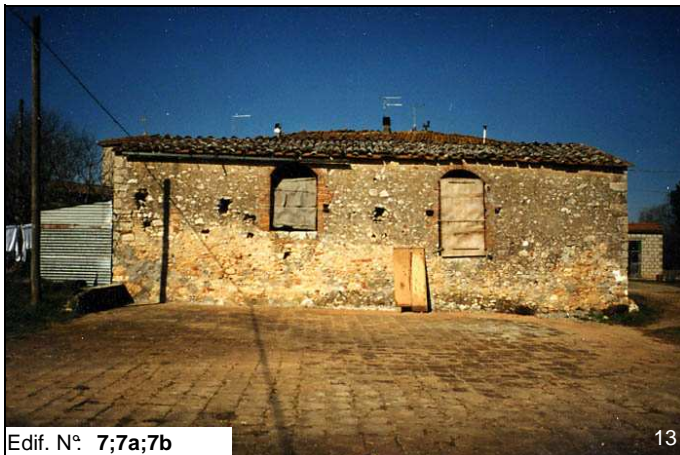
Edif. N° 7;7a;7b