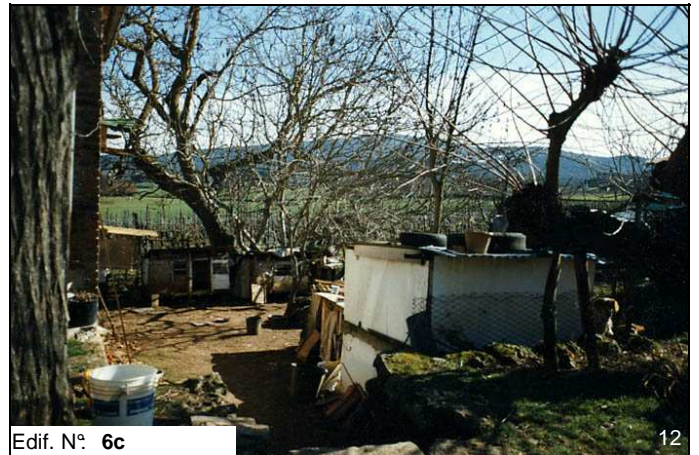
Edif. N° 6c