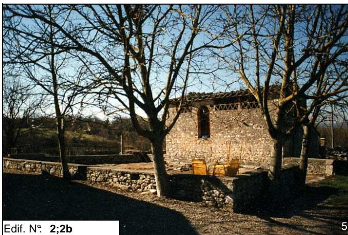
Edif. N° 2;2b