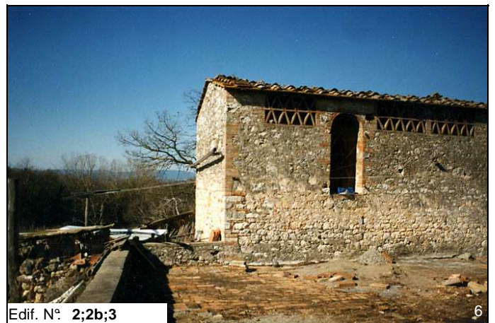
Edif. N° 2;2b;3