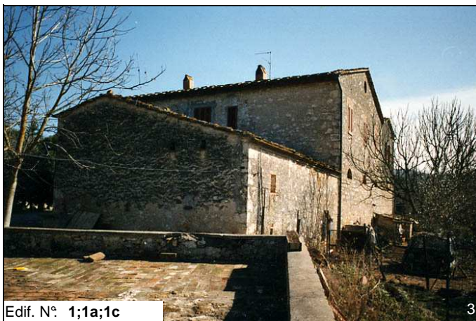
Edif. N° 1;1a;1c