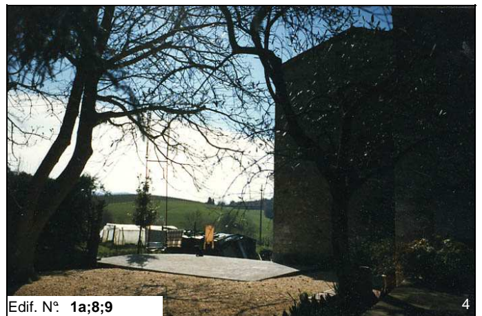
Edif. N° 1a;8;9