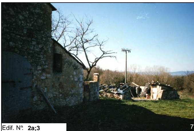
Edif. N° 2a;3