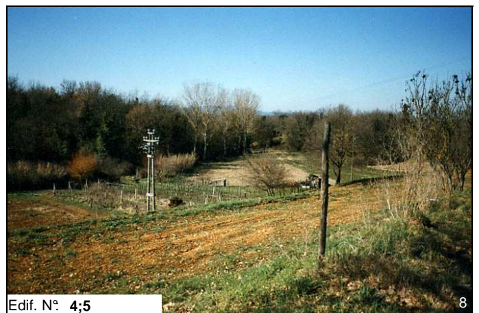
Edif. N° 4;5