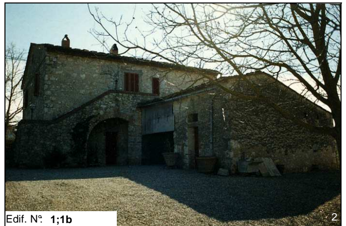
Edif. N° 1;1b