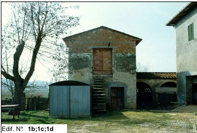
Edif. N° 1b;1c;1d