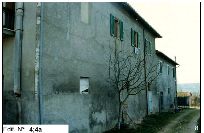
Edif. N° 4;4a