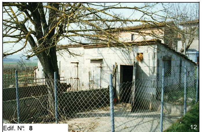
Edif. N° 8