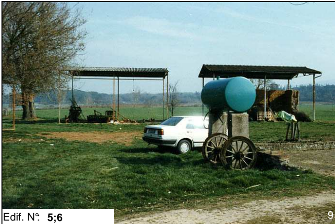
Edif. N° 5;6