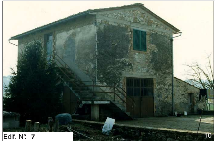
Edif. N° 7