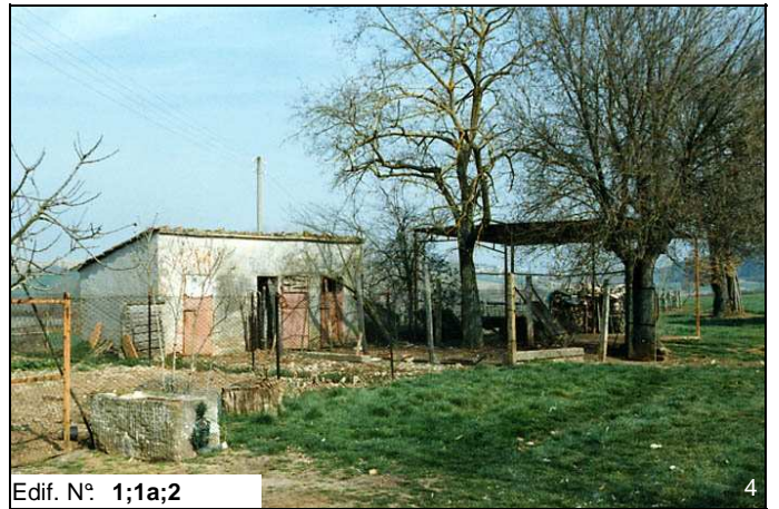
Edif. N° 1;1a;2