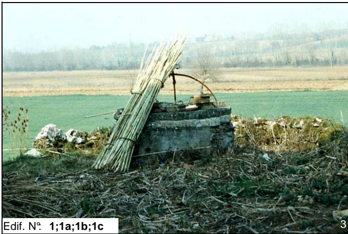
Edif. N° 1;1a;1b;1c