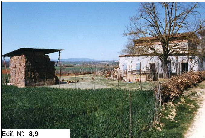
Edif. N° 8;9