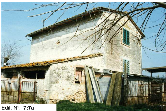
Edif. N° 7;7a