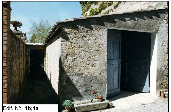
Edif. N° 1b;1a