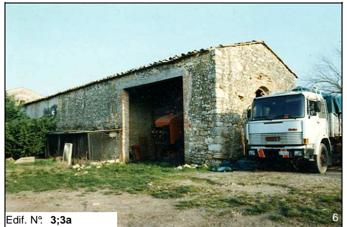
Edif. N° 3;3a