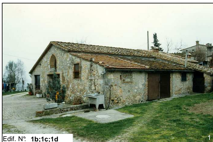
Edif. N° 1b;1c;1d