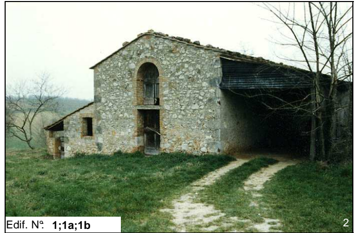
Edif. N° 1;1a;1b