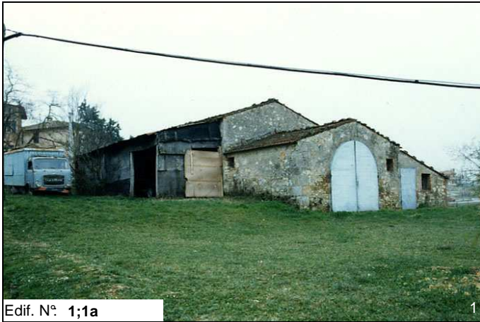
Edif. N° 1;1a