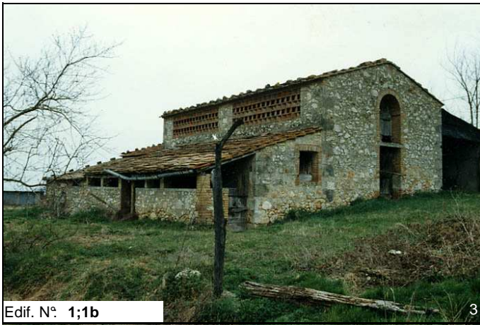
Edif. N° 1;1b