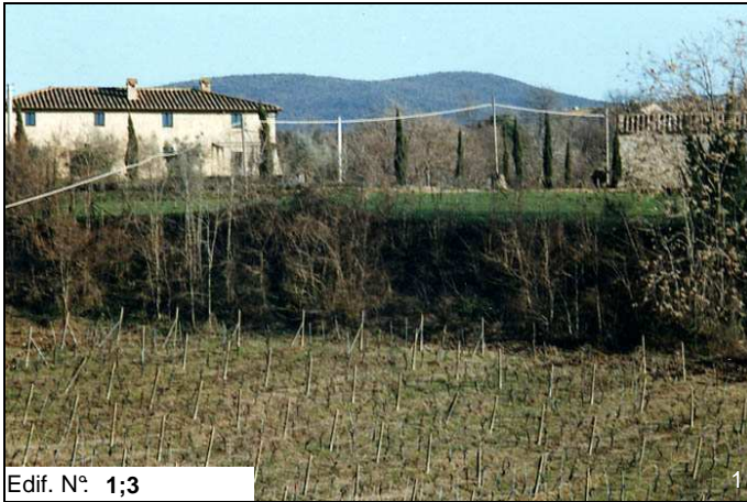
Edif. N° 1;3