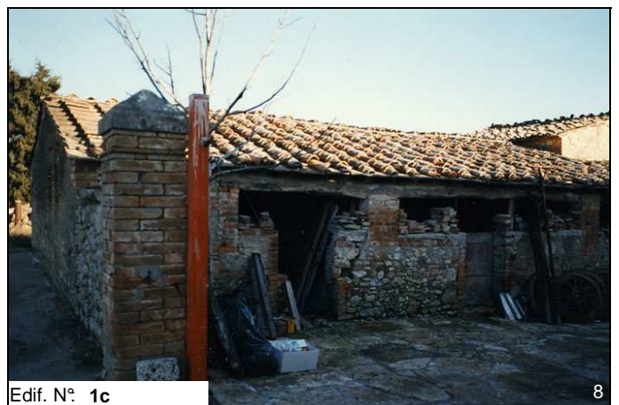
Edif. N° 1c