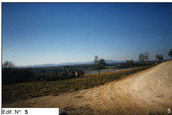
Edif. N° 5