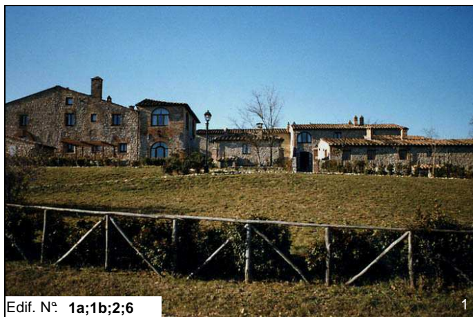
Edif. N° 1a;1b;2;6