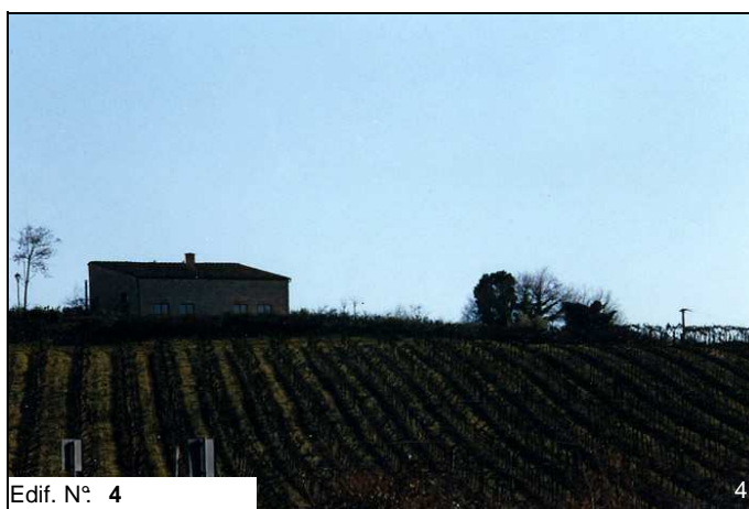
Edif. N° 4