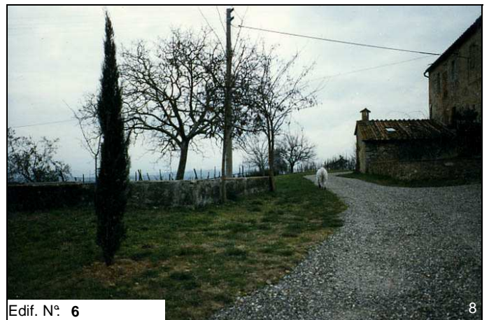
Edif. N° 6