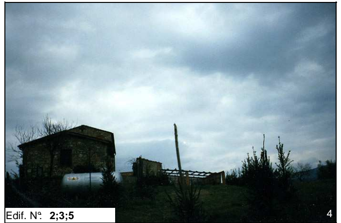
Edif. N° 2;3;5