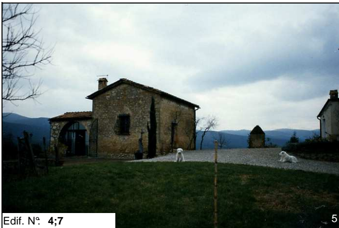
Edif. N° 4;7