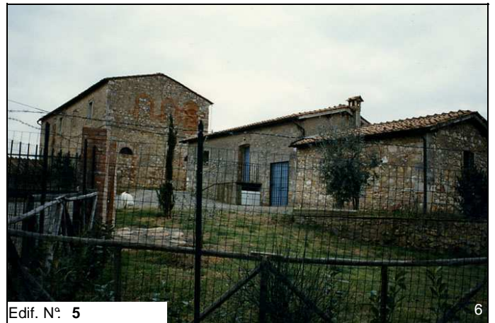
Edif. N° 5