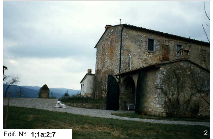
Edif. N° 1;1a;2;7