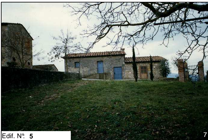
Edif. N° 5