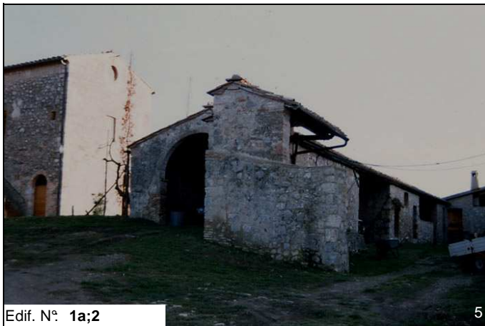
Edif. N° 1a;2