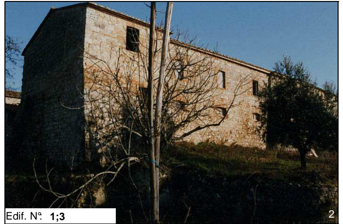
Edif. N° 1;3