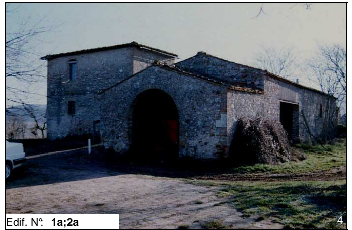
Edif. N° 1a;2a