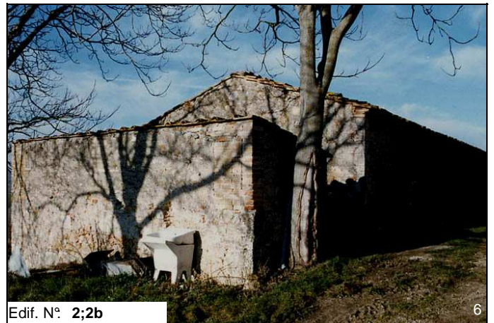
Edif. N° 2;2b