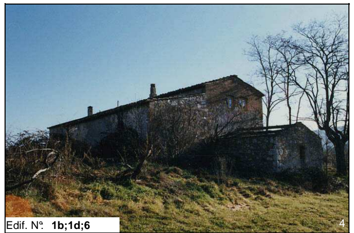
Edif. N° 1b;1d;6