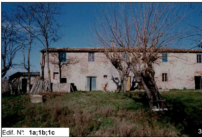
Edif. N° 1a;1b;1c