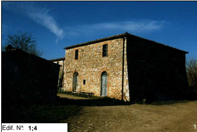
Edif. N° 1;4