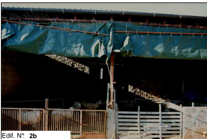
Edif. N° 2b