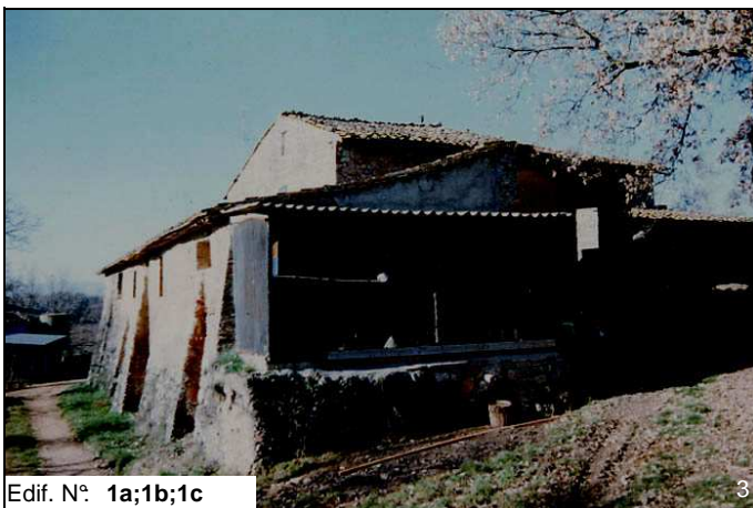
Edif. N° 1a;1b;1c