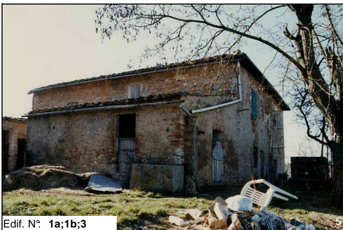
Edif. N° 1a;1b;3