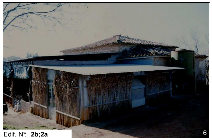
Edif. N° 2b;2a