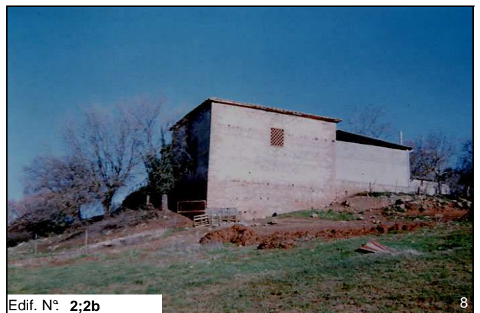
Edif. N° 2;2b