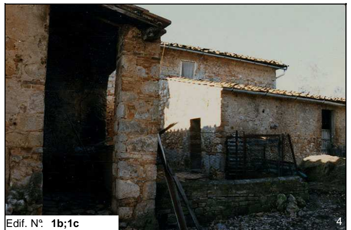
Edif. N° 1b;1c