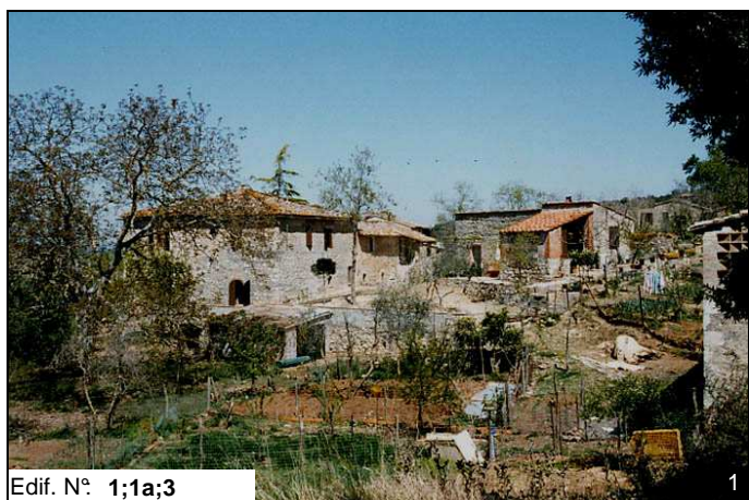
Edif. N° 1;1a;3