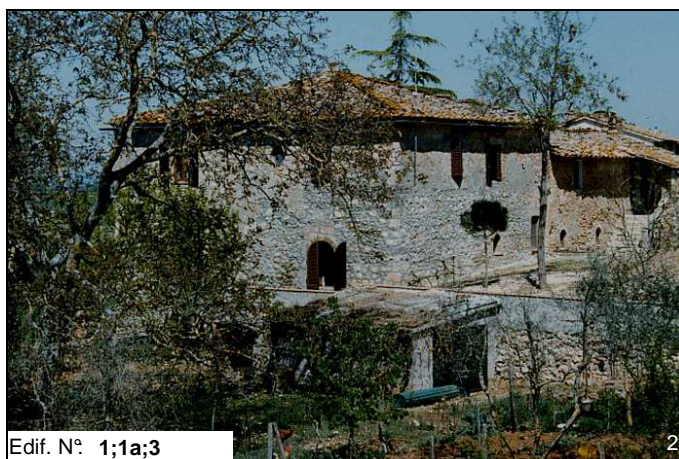
Edif. N° 1;1a;3