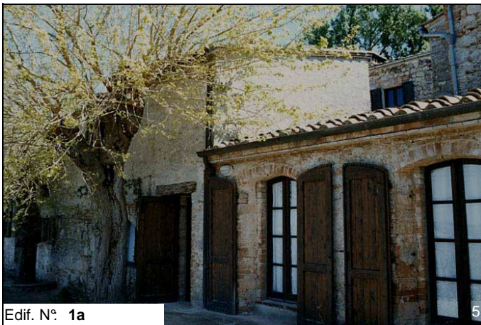
Edif. N° 1a