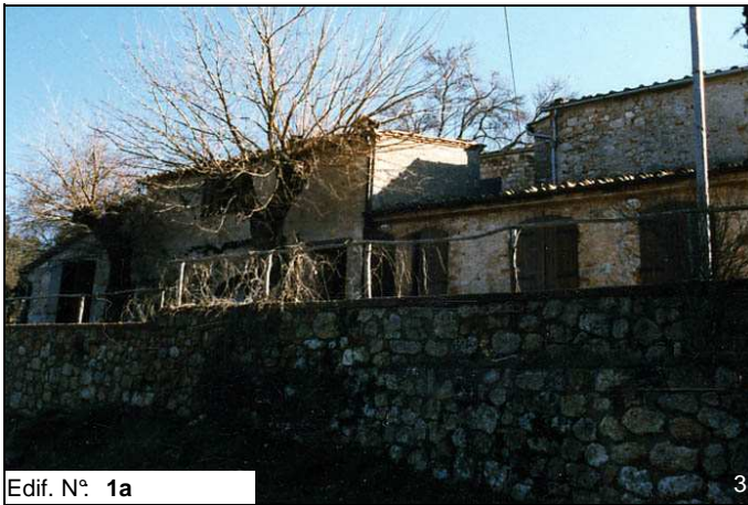
Edif. N° 1a