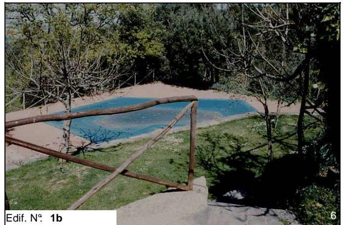
Edif. N° 1b