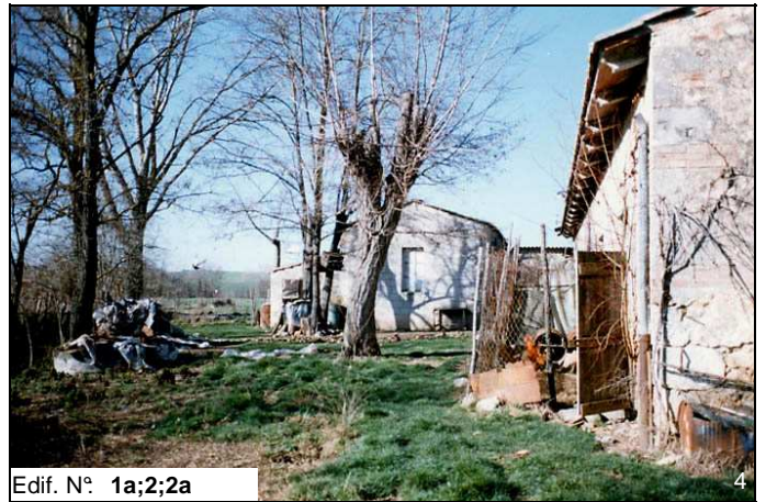
Edif. N° 1a;2;2a