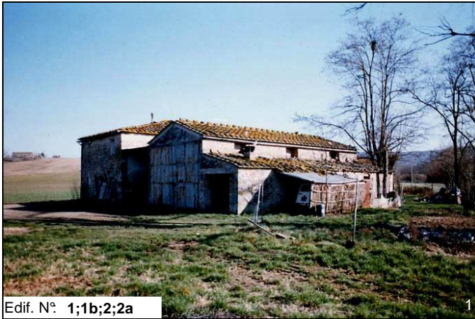
Edif. N° 1;1b;2;2a