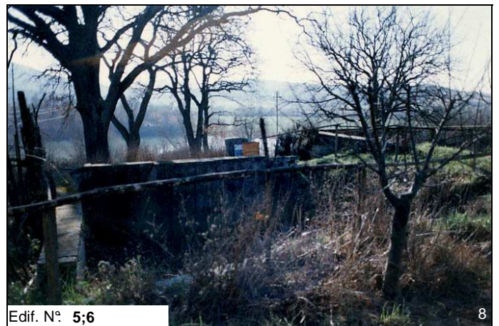
Edif. N° 5;6