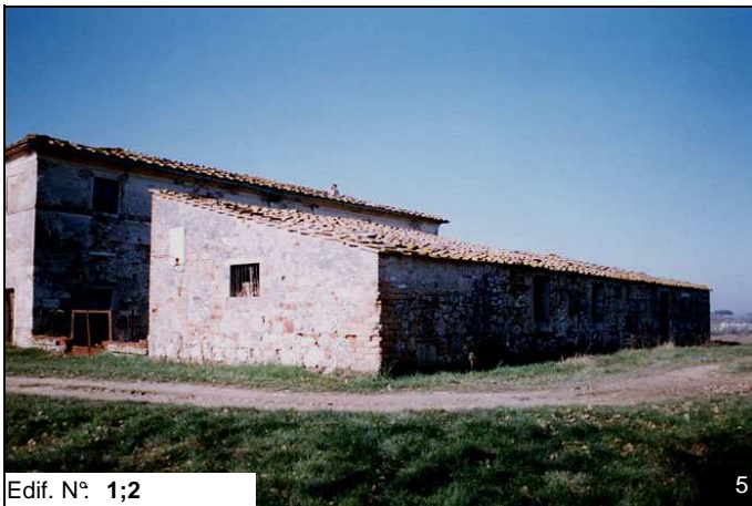
Edif. N° 1;2