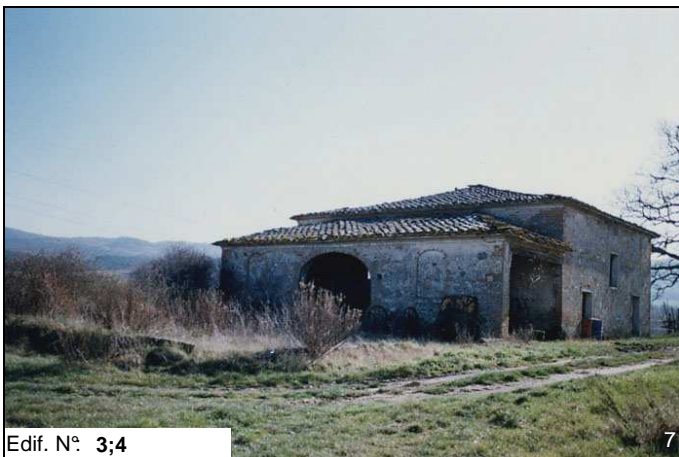
Edif. N° 3;4