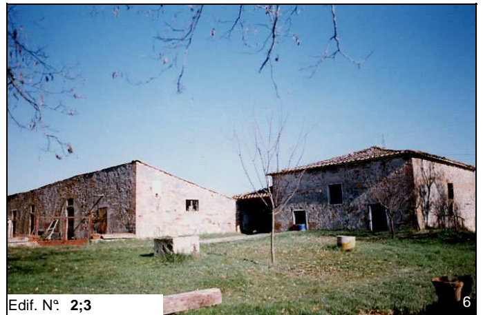
Edif. N° 2;3