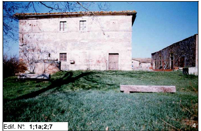
Edif. N° 1;1a;2;7