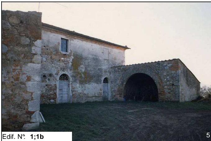
Edif. N° 1;1b