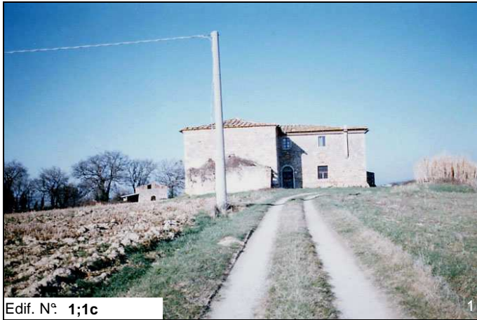
Edif. N° 1;1c