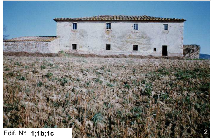
Edif. N° 1;1b;1c