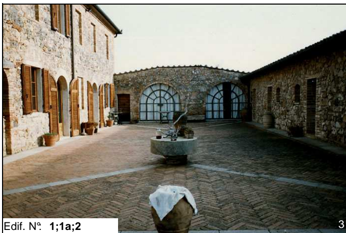
Edif. N° 1;1a;2