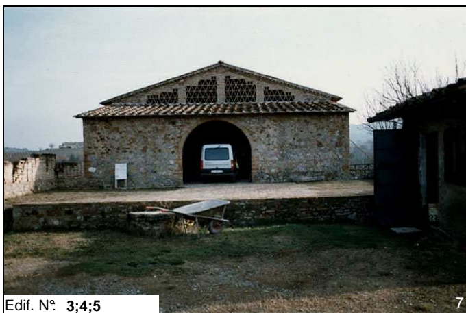
Edif. N° 3;4;5