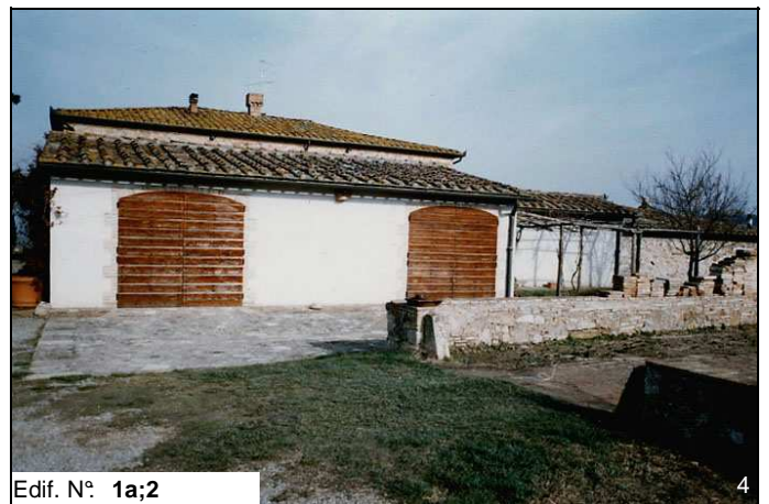
Edif. N° 1a;2