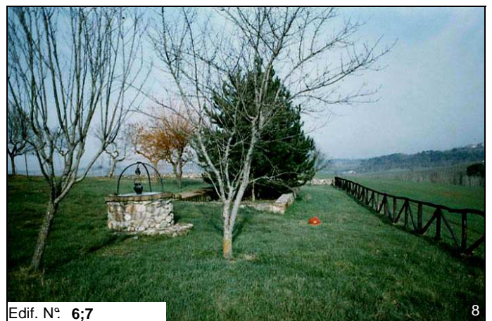
Edif. N° 6;7