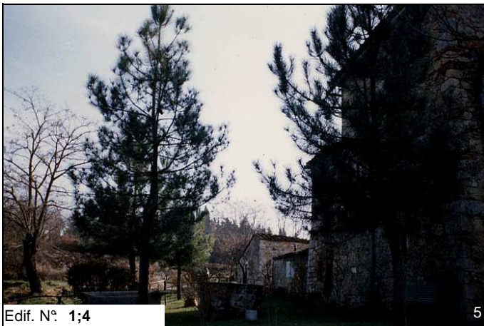
Edif. N° 1;4