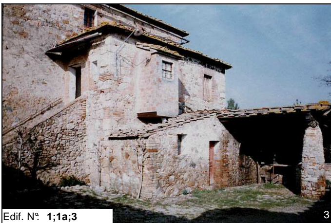
Edif. N° 1;1a;3