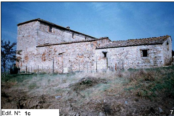
Edif. N° 1c