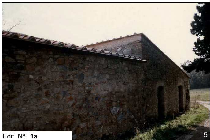
Edif. N° 1a