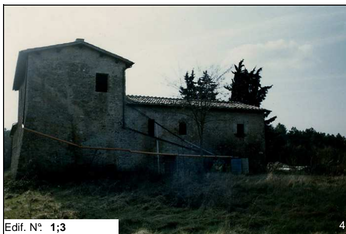
Edif. N° 1;3