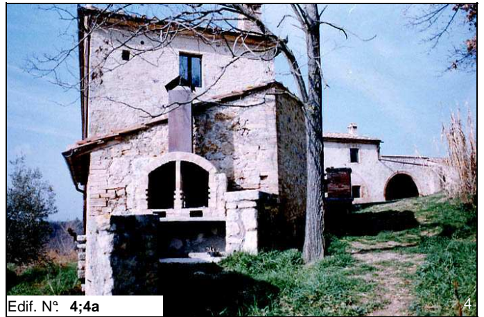
Edif. N° 4;4a