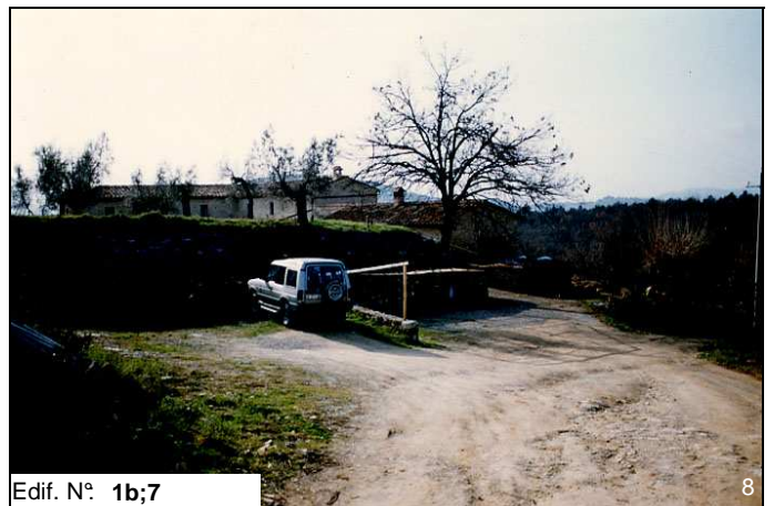
Edif. N° 1b;7