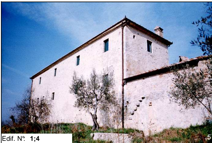
Edif. N° 1;4