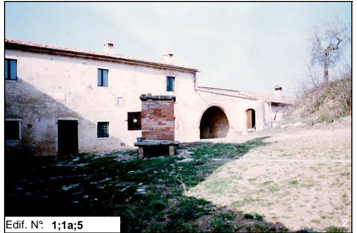
Edif. N° 1;1a;5