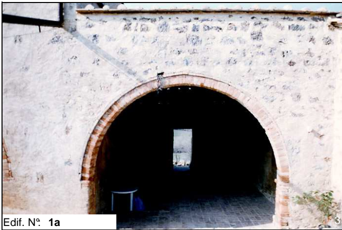
Edif. N° 1a