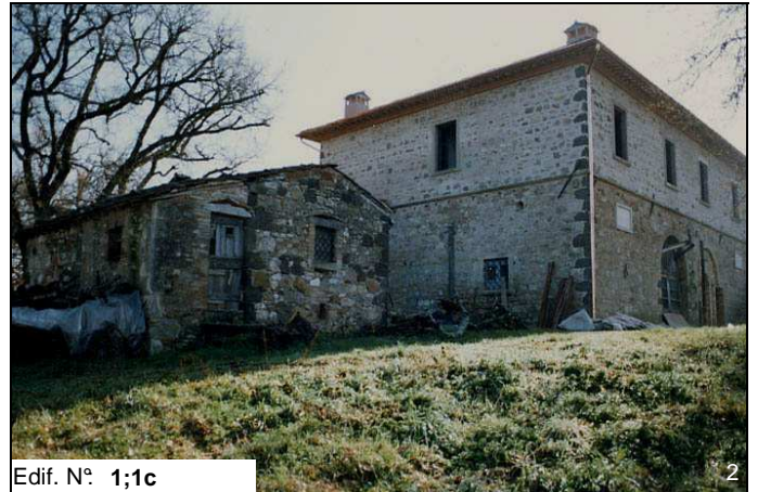
Edif. N° 1;1c