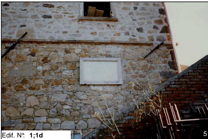
Edif. N° 1;1d