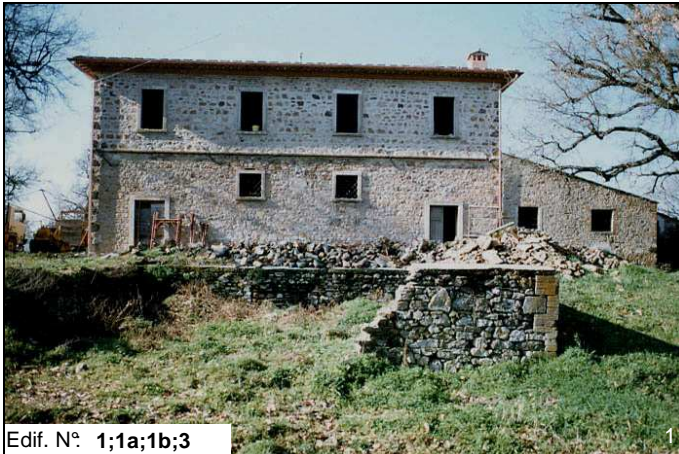
Edif. N° 1;1a;1b;3