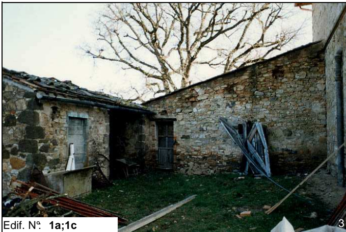
Edif. N° 1a;1c