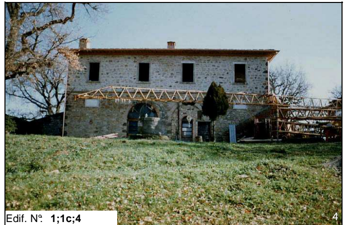
Edif. N° 1;1c;4